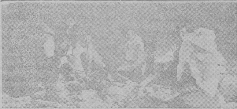
Jotta gást Sameádnamest.

Čali Jens Vevestad mittom darogiel blađest.