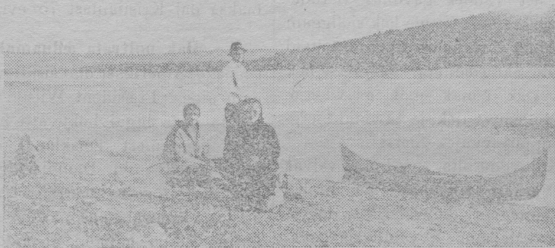
Gieldadoavter Garašjogast gæssejottolagast.

Son čalla: Sameádnam læ mainasádnam, Norga mainasádnam. Dat læ celkkum ja čallum davja ouddal, mutto juokkehaš gutte boatta dokko davas ja læ oappam dovddat Sameádnam luondo ja dilalašvuoda, oažžo duodastusa dam ala atte dat læ duotta mi læ celkkujuvvum.