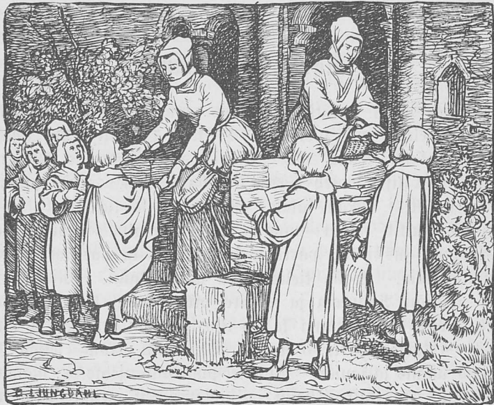
Märten Luther ja ietja häjos škäula-manah lauloš piepmo tieti almatji uwsai äütän.