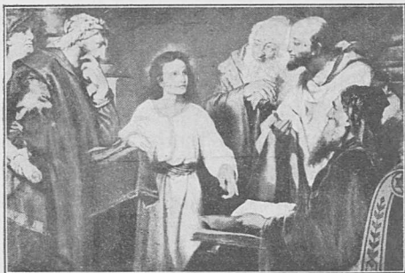
Jesüs tämpela sinne, kâ jän lä 12 jake wuoras.

tat, kâ mian lä takkar käino Supmela lusa. Kättjalop mannat tan käino milte, te mi ädtjop Supmela waštatusjaw. Warfa kaikah Davida jalmah mia bibela sinne läh räkkälwajah. Ja mädde jalmah sinne lä alko nâu jurkolatj, walla kietje nâu awos. Almatjah, kutih äh täptäh Supmelaw ja räkkälwajaw, imastallih tan tieti, kâ ju jurko näkka nâu warfa. Dat lä räkkälwis, mi lä taw ietjaituwvamaw takkam. Alkon luodjo David ietjas hietew Supmela äutän, ja te jän häkkat täbta Supmela waštatusjaw ietjas waimon; te lä luodjom näkkäm, ja hiewetus ja kito padjan alme kuouloi.