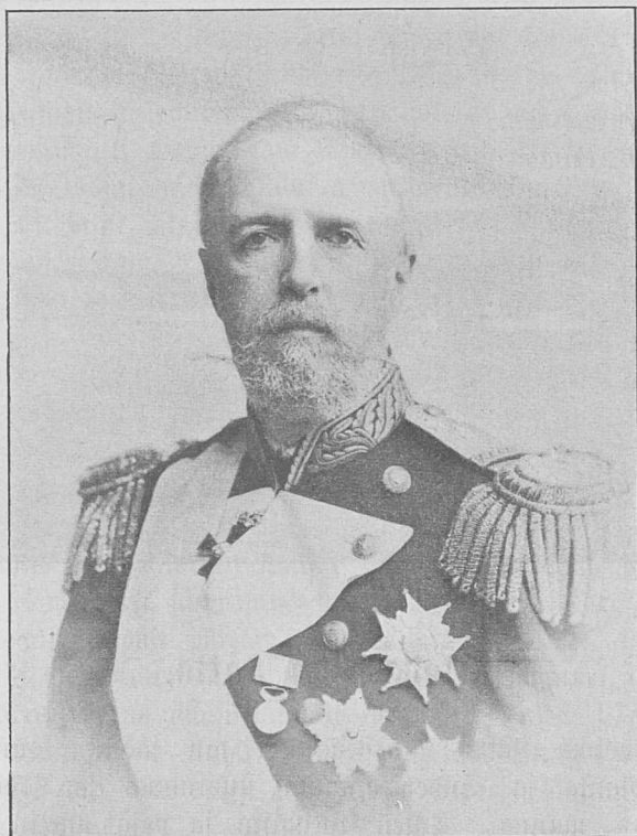
Rånåsis Öskar 2.