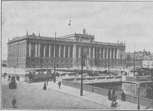
Riksdaga tâppe Stockholmân.

Nuppen Kammarin jis jala Riksdaga nuppen âsen tjâffâhij âlmah, kutih lâh âllo ietjalakai waljitum. Jus kuttik teuno âtasit faktse tjuote fruno âwtân jaken, jala jus sân atna häimaw, man hadde lâ âtasit tušan fruno, te sân âdtjo waljit takkar riksdagsâlmaw, ja waiko sân lului man pânta, te sân i tauk aneh ânap famow tan waljimin kâ ietjatah, ainat fârtahatj atna tâsje wal âwtân jienaw, te kâ jaulih, jala taro kielâ milte rôst, ja kaikah