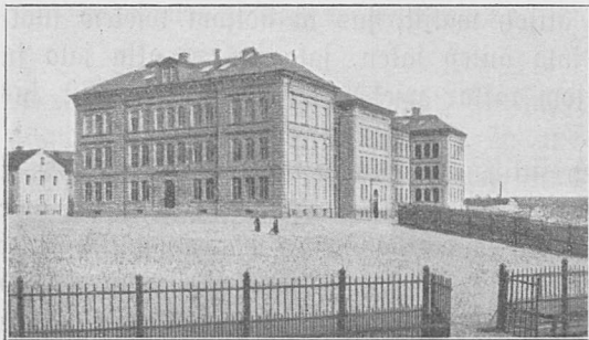
Sämes skäula-läppe Stockholm.

Stuorak lä sjeunjiswuota äutep aiki ärvom mia lantan, ja ätna sjeunjiswuota kauno kalle wil udnik. Puorep lä tauk tappe