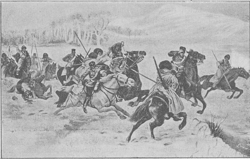
Karjelah ja japanalattjah tärro.

9 peiwen februari- jala kuowa-manon 1904 alki tärro ja japanalattjah mattin talaka täšjtit muttemit karjeli tärro-hawšaišt. Karjelah stuorastallin ja jakkin, atte lului alke täšjtit Japana rikaw. Walla talloi päštöt jakkin. Japanalattjah widnijin ahtat