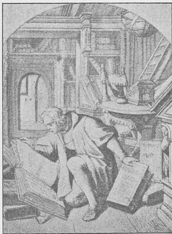
Luther kauna bibelaw.

Tasa pátin sámes tuotalatj älkoltis atah. Ukta su wánakišt jami háffat olikkolatj šáitema pakto. Sámes aite mangel pátatalai sán ietj sieltes atja=talkai, ja ältakis tšásetuwai ätnami su paltai, náu atte sán palost šájáti puolwai nala.