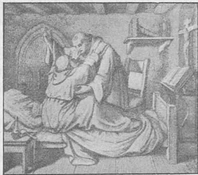
Munka jafat Lutheraw.

Te päta wuoras, äwtäkärtasatj munka Luthera lusa. San i läh nau lärtok, walla tauk san täbta ietjas jafotäptästimew, ja san tadjata taw. Ja jafotäptästimen san kauna taw, mi matta kadjot Lutheraw su jappem-nietaft.