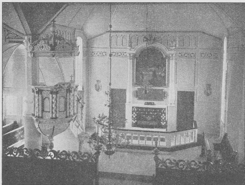
Arjeppluowe kirko ſiſngelt.