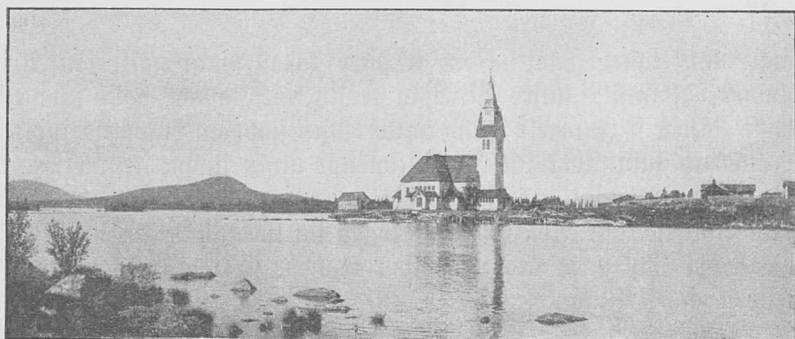
Arjeppluowe kirko ätästuwama mangel.