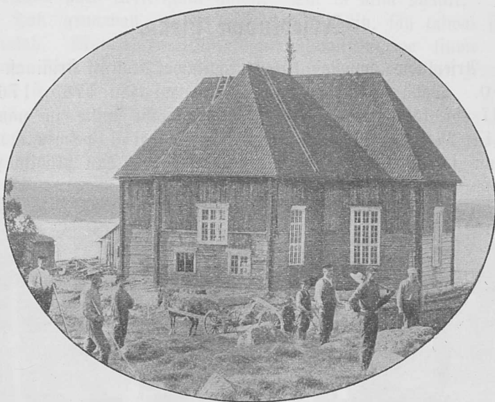
Arjepluowe firko átãstuwama autãl.