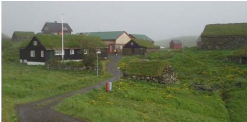
Útisavn í Hoyvík

Um umsitingin hjá Fornminnissavninum verður flutt, má havast í huga, at útisavnið, sum Fornminnissavnið seinastu árinum hevur bygt upp kring bygningarnar á gamla Hoyvíksgarði, verður manntómt. Neyðugt verður tí at skipa annað slag av dagligari umsjón á útisavninum, og tað hevur øktar lønarútreiðslur við sær.