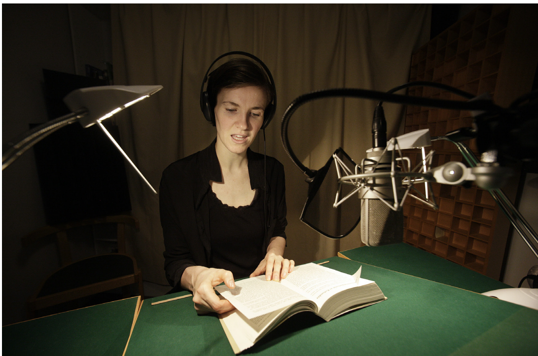
Í studio á Ljóðbókatænanastuni.

Vandin at verða burtur í einum størri stovni, kann mótvigast við, at uppgávan at veita ljóðbókatænanastu verður nágreinað í eini dagførdari bókasavnslóg.