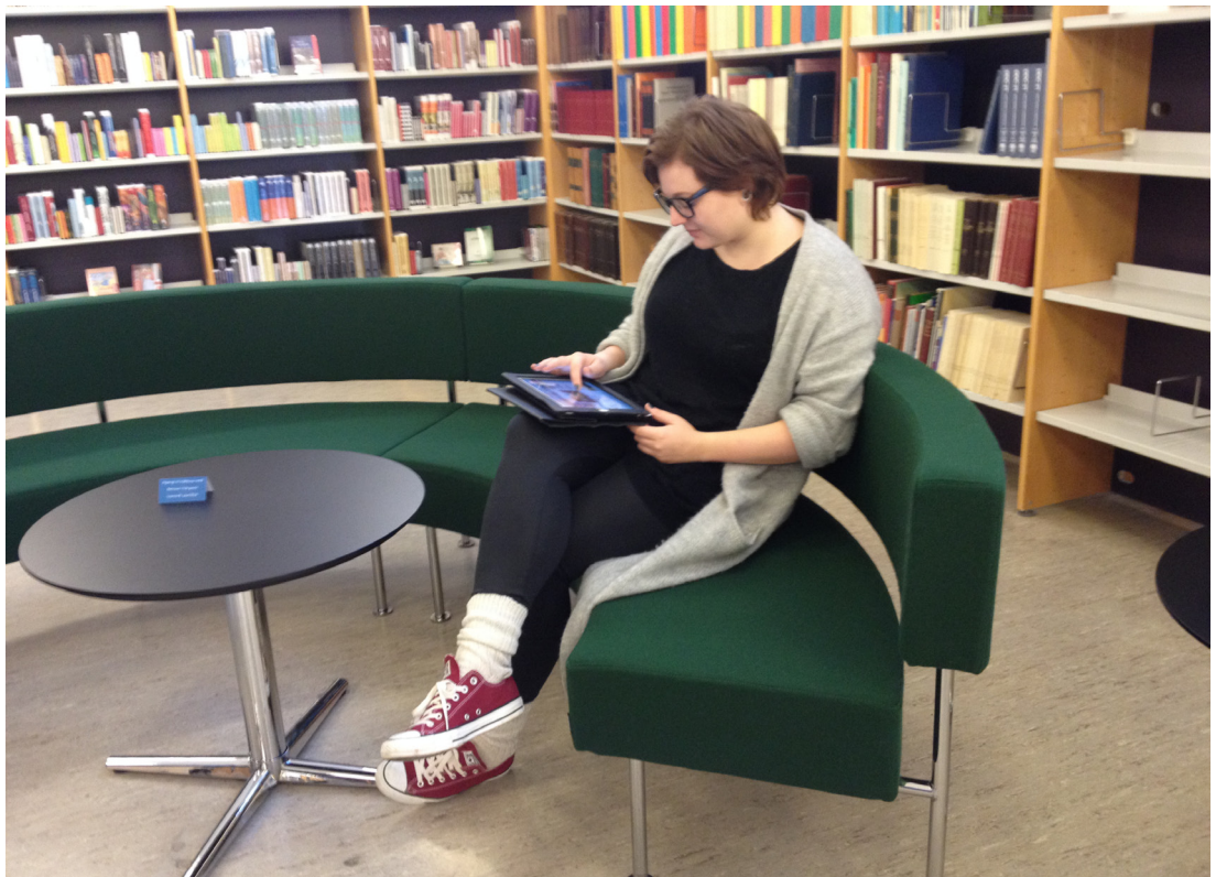
Lesikrókur á Landsbókasavninum.

Blind, sjónveik, sjúk, vanfør, orðblind og lesiveik fáa lisið e-bøkur við teldutalu. Hóast teldutala ikki er eins góð og ein ljóðbók, so geva e-bøkur saman við teldutaluni hesum borgarum atgongd til tilfar, sum ikki er tøkt sum ljóðbók.