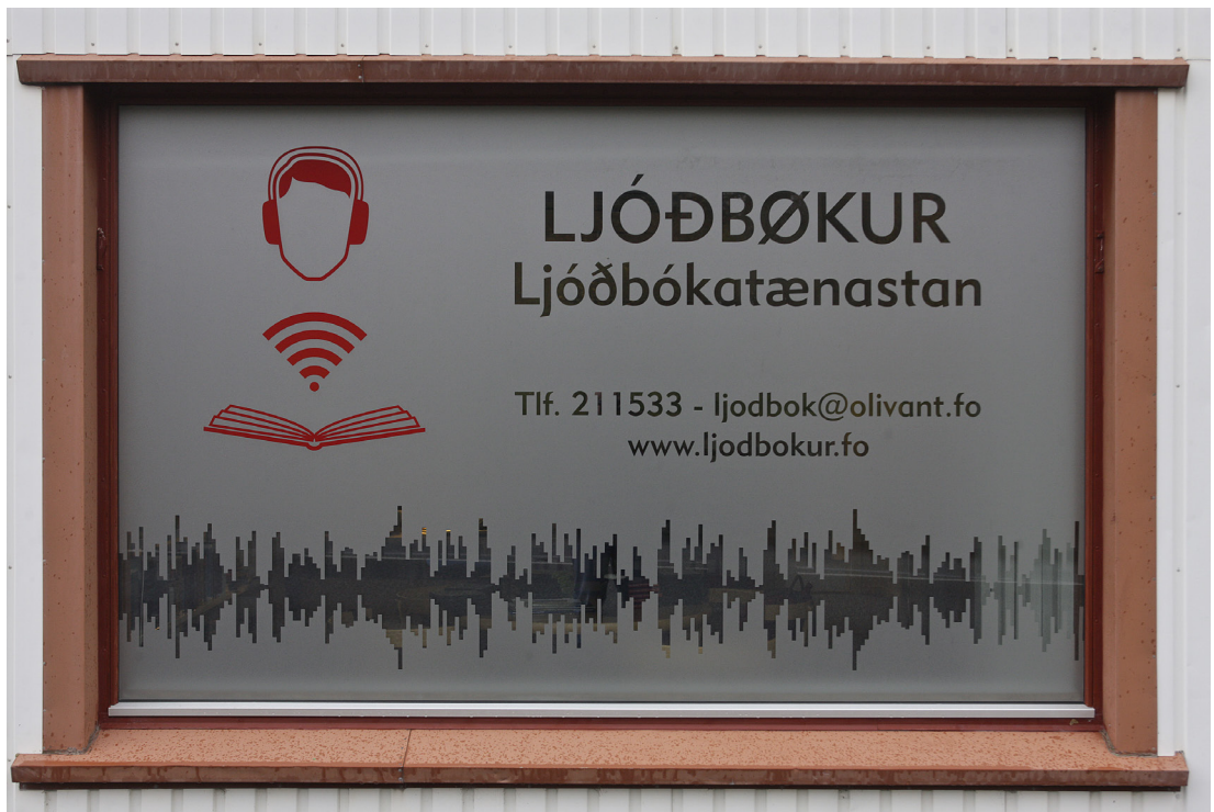
Ljóðbókataenastan í J.C. Svabosgøtu 57.

Forlagið Ljóðbøkur metir, at útreiðslurnar at framleiða eina ljóðbók eru umleið kr. 100 kr. fyri hvørja síðu. Forlagið hevur tikið avgerð um, at søluprísurin á ljóðbókum skal vera áleið tann sami, sum á pappírskókum, so at ljóðbøkur ikki eru dýrari fyri brúkararnar enn pappírskøkur.