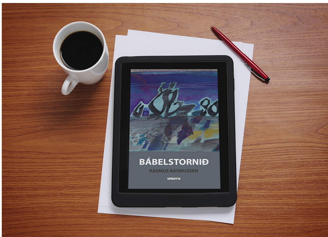
Skaldsøgan Bábelstornið er útgivin sum ljóðbók og e-bók.

Í mun til bókasavngjaldið fyri bókasavnstænastur á netinum má ein skipan gerast, ið tekur støðu til, hvussu rættindahavarar verða avroknaðir.