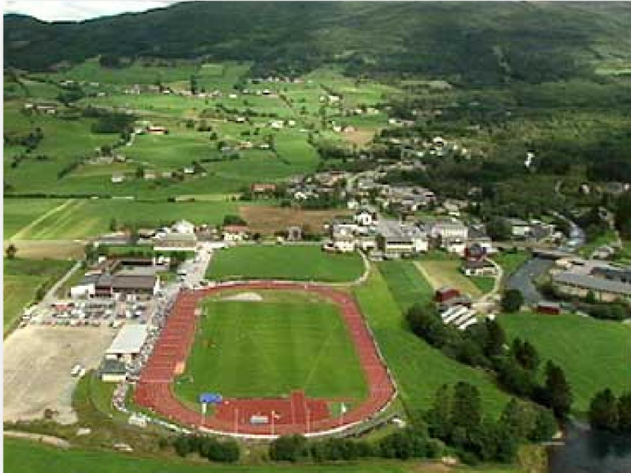
Byrkjelo stadion úr luftini

Í bygdini Byrkjelo, sum er í eystara parti av Gloppen kommunu (sí kort á síðu 9), hava tey eina langa røð av verkætlanum, sum eru grundaðar á sjálvboðna arbeiðsmegi, á "dugnad", sum tey siga i Norra.