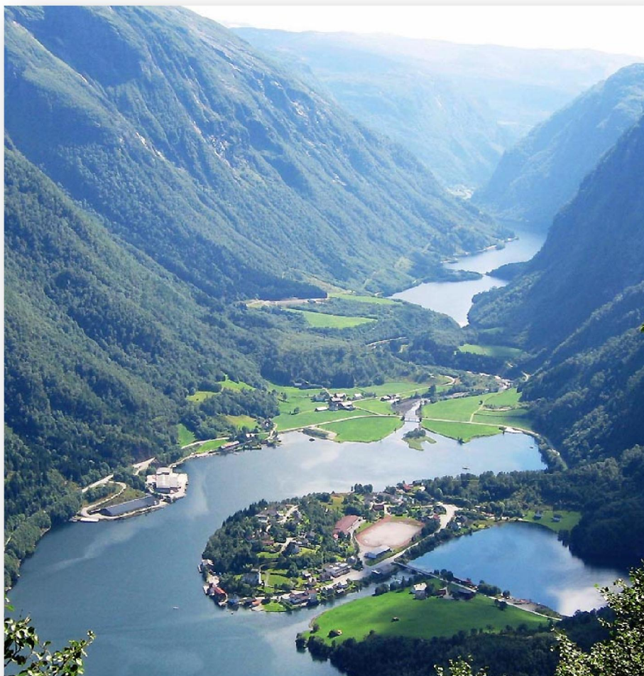
Hyen liggur í vøkrum umhvørvi

Bæði í Norra og Danmark eru traditióinir fyr at hava lokal menningarráð, í Norra utviklingslag og í Danmark udviklingsråd . Í bygdini Hyen í Gloppen kommunu er endamálið við lokala menningarráðnum í breiðasti tulkning at arbeiða við menning í lokaløkinum.