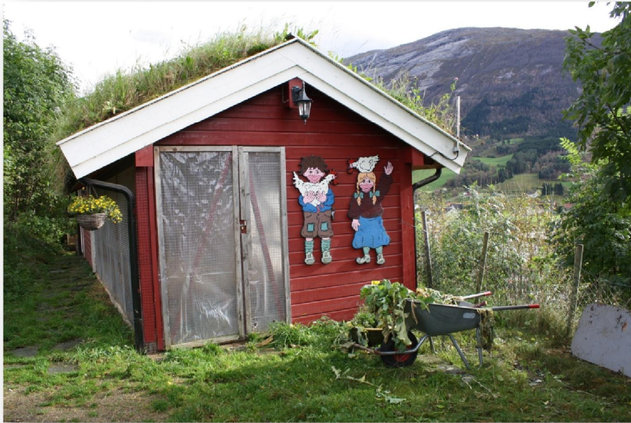
Høsnarhúsið í Teina Barnehage

Komandi ár verða barnagarðarnir í Reed (Teina Barnehage) og Byrkjelo lagdir saman, tá fylgir høsnagarðurin við. Meiri um samanleggingina av barnagørðunum báðum í næstu grein.