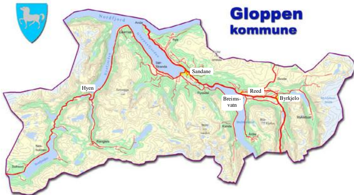
Kort yvir Gloppen kommunu