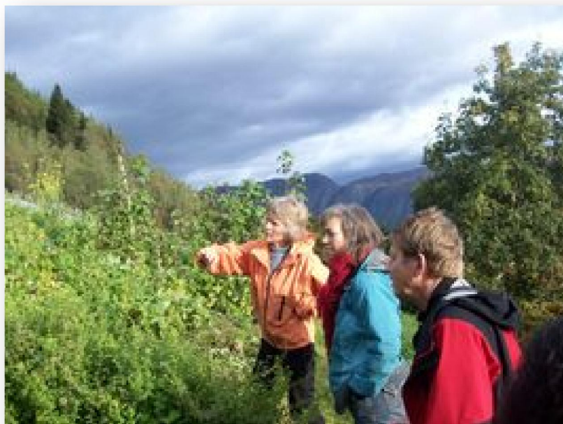
Skúlanæmingar á Gardsarbeið á Felda Fellesfjøs

Bøndur í Gloppen hava saman við framhaldsdeildini í fólkaskúlanum skipað soleiðis fyri, at allir næmingar hvørt ár fara runt á bóndagarðar. Hetta samstarv er partur av breiðari samstarvi, sum er fingið til vega av Sogn og Fjordane Bondelag og fólkaskúlunum í Sogn og Fjordane fylke. Endamálið við samstarvinum er at geva skúlanæmingum í framhaldsdeildini innlit í og førleikar um bóndalívið, og hartil ikki minst at geva teimum íblástur til at velja eina útbúgving og eitt yrki við tilknýtið til landbúnaðin.