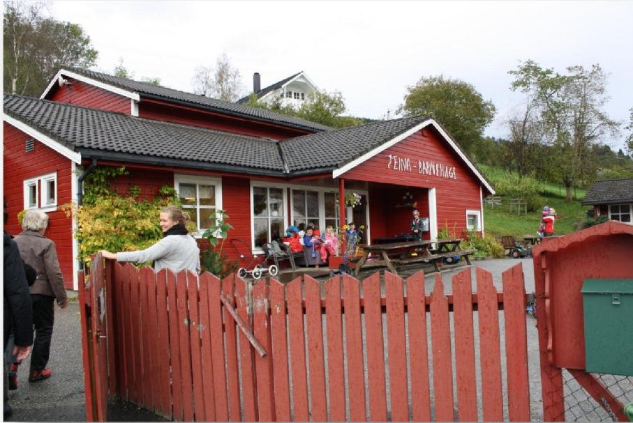
Teina Barnehage, barnagarður við høsnagarði

Í Norra verður dentur lagdur á entreprenørskap heilt frá barnárunum. Í barnagarðurin Teina barnehage í bygdini Reed í Gloppen kommunu, hava tey í 15 ár havt ein entreprenør-barnagarð, tey hava í 15 ár havt ein høsnagarð við barnagarðin.