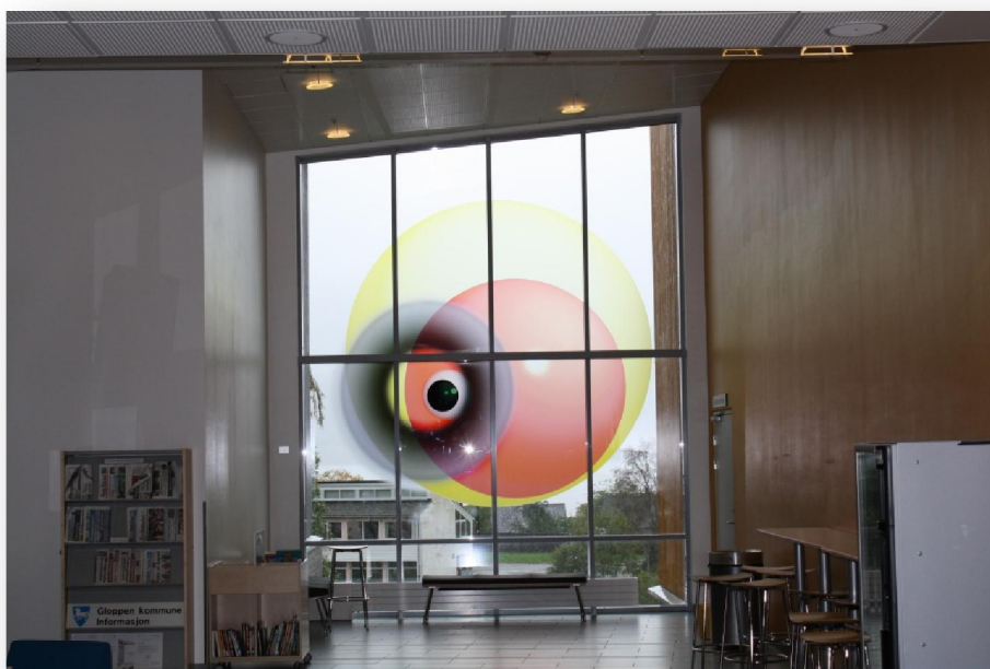
List í Trivselshagen

Meiri kunning um Trivselshagen finnur tú á www.trivselshagen.no