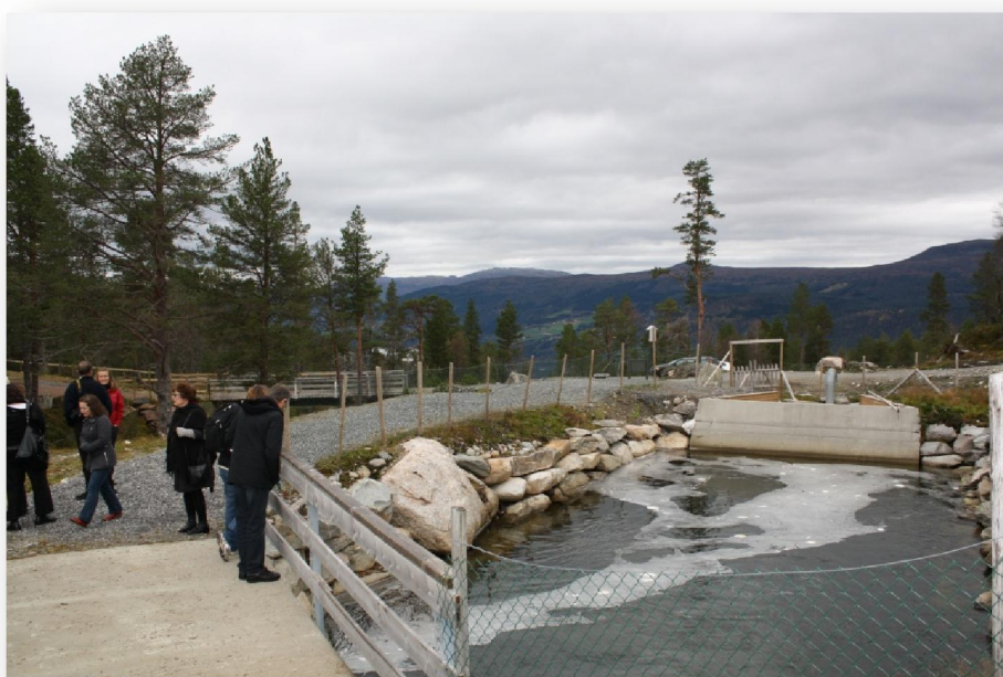
Vatnið verður tikið úr ánni 300 m. hægri uppi