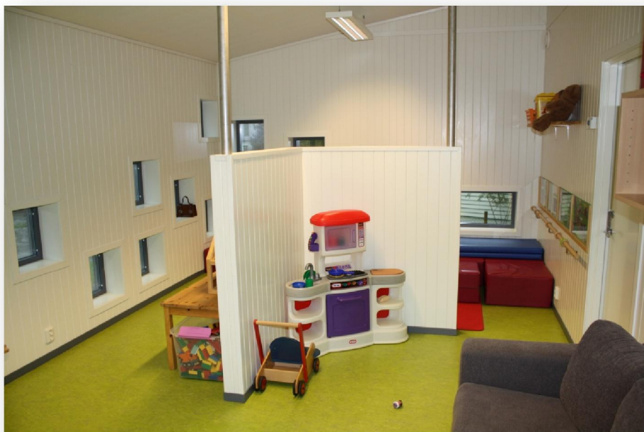
Nýggi barnagarðurin í Hyen

galdandi fyr lokala skjóti-felagið (skjóti-ítróttur er stórir í Norra), sum í oktober tók í nýtslu nýggj høli í kjallaranum á nýggja barnagarðinum.