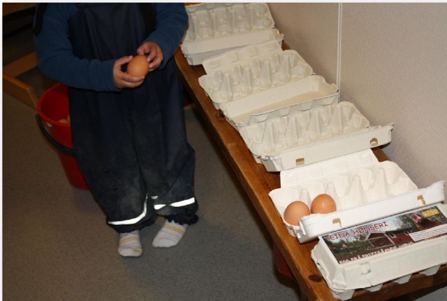
Børnini halda sjálvi skil á