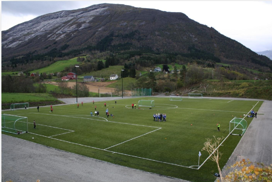
Nýggjur graslíkisvøllir við barnagarðin í Reed

Breim Barnehage, sum nýggi samanlagdi barnagarðurin eitur, hevur egna heimasíðu: www.breimbarnehage.no