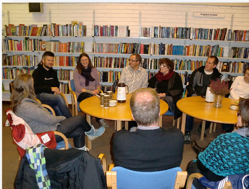
Leiðarin av Hyen Utviklingslag og skúlastjórinn (longst til vinstru)