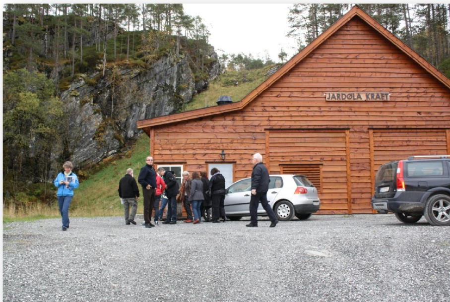
Vatnkraftverkið Jardøla Kraft

Seinastu árin er tað vorðið alsamt meiri vanligt, at smærri privat vatnkraftverk verða bygd í Norra. Í Gloppen kommunu eru tað nú 20 smá vatnkraftverk, sum framleiða el, sum tey selja til eina størri el-framleiðara í økinum. Tey privatu vatnkraftverkini í Gloppen eru frá heilt smáum verkum, sum framleiða til 1-2 húsarhald, til størri kraftverk, sum framleiða el til fleiri túsund húsarhald.