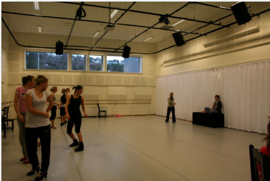
Tað stóra dansi-venjingarhøli

Við tað at møguleiki er at velja dans og drama á breyt í studentaskúlanum, so hava tey í Trivselshagen eisini lagt seg eftir at hava góðar umstøður á hesum økinum.