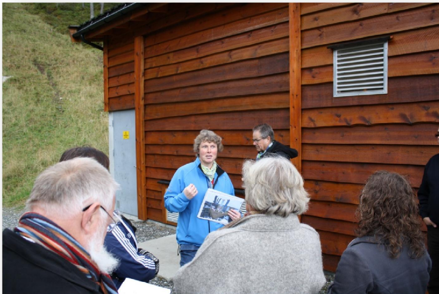
Ein av eigarunum av Jardøla Kraft greiðir frá

Ein av eigarunum av Jardøla Kraft, sum vístu okkum runt og greiddi frá vatnkraftverkinum, segði, at fyri tey, sum fyrr høvdu livað av landbrúkinum, var hetta eitt sera gott, og fyri summi eitt avgerandi ískoytið fyri framhaldandi at kunna búgva á staðnum.