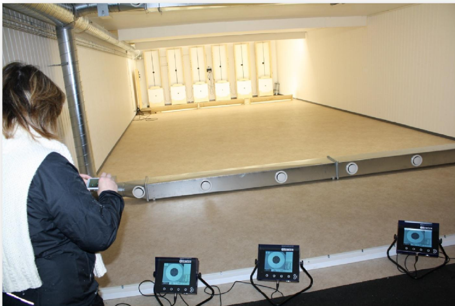
Skjótifelagið nýggj høli

Hyen Utviklingslag hevur eisini havt undangongu leiklutin, tá lokal tænastr- og frítíðartilboð skulu mennast og útbyggjast.