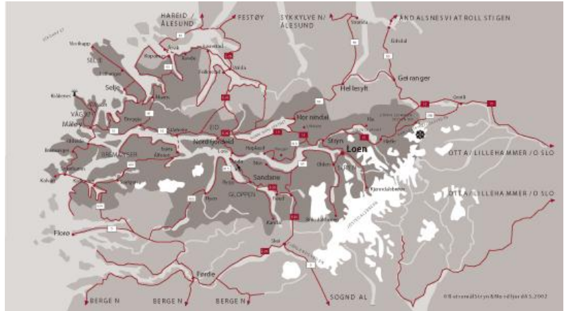
Kort yvir Sogn og Fjordane fylke