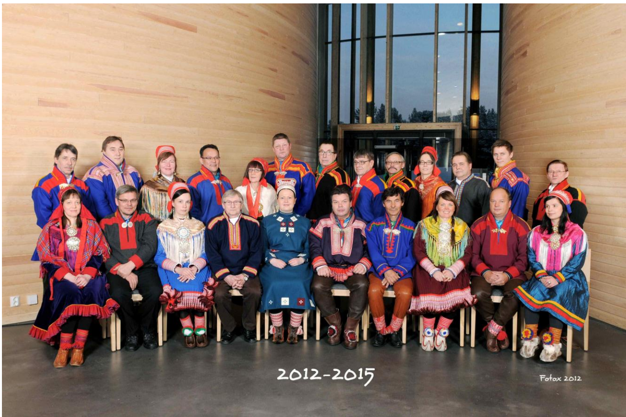
Kuva 2 Saamelaiskäräjät 2012-2015