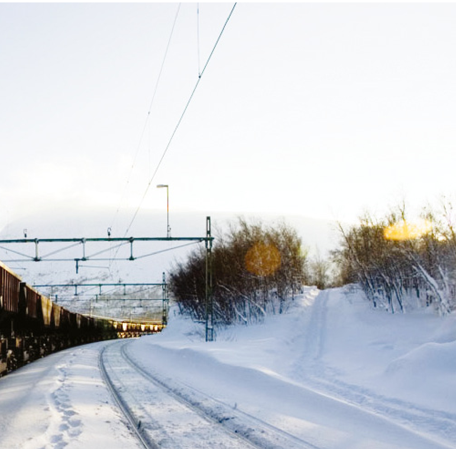
Malmtoget på Ofotbanen