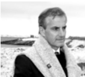
JONAS GAHR STØRE Utenriksminister

Nordområdene er regjeringens viktigste strategiske satsingsområde i utenrikspolitikken, som nedfelt i regjeringserklæringene Soria Moria I og Soria Moria II. Nordområdestrategien av 2006 presenterte hovedlinjer i politikken, og i oppfølgingsdokumentet Nye byggesteiner i nord av 2009 lanserte regjeringen satsinger over et 10–15 års perspektiv.