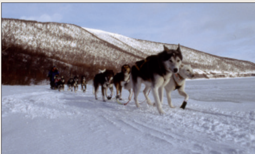
Finnmarsløpet er verdens nordligste trekkhundløp og en stor begivenhet.