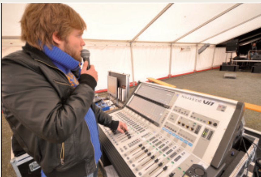
Målsettingen er 500 arbeidsplasser innen kultur i Finnmark.