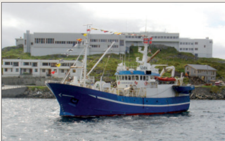
Finnmarksfisk med Nordkapp maritime fagskole og videregående skole i bakgrunnen.

Figuren nedenfor viser innplasseringen av fagskoleutdanningen i det norske utdanningssystemet. Fagskoleutdanning skiller seg fra