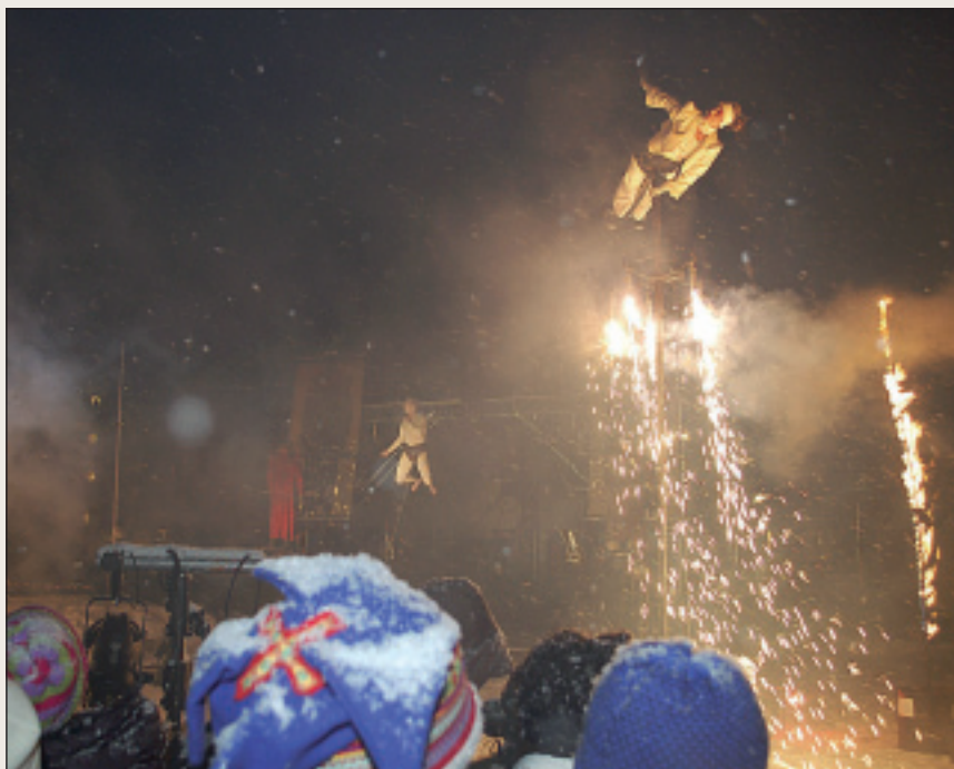
Kulturnæring er i sterk vekst internasjonalt og i Norge.

Rekrutteringsgrunnlaget for en slik fagskole kan være relativt bredt. Det kan være etablerte bedriftseiere som ser behov for mer kompetanse. eller