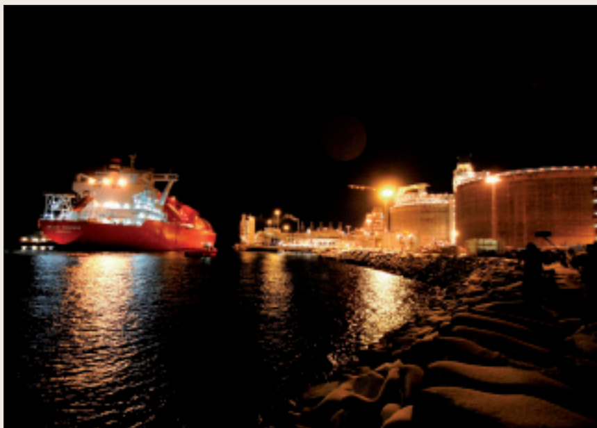
Antallet arbeidsplasser i energibransjen har økt kraftig i Hammefest som følge av Snøhvit-utbyggingen.