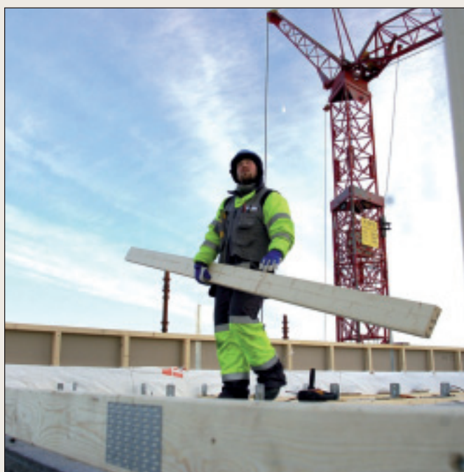
Nora-senteret i Kirkenes under bygging.