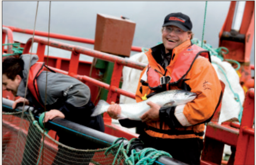
Oppdrettsnæringen i Finnmark har behov for kompetent arbeidskraft.

Matindustrien i Finnmark preges av mange små aktører innen landbruk og reindrift, samt noen større aktører innen sjømat. I tillegg er det et voksende marked for små-skala produksjon av lokal mat. Oppdrettsnæringen er de største aktørene, og disse har et tydelig behov for kompetent arbeidskraft.