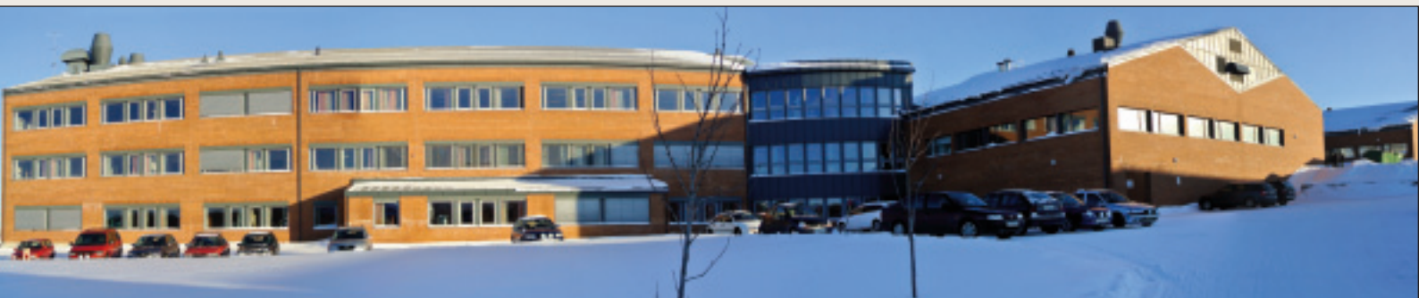
Kirkenes videregående samarbeider med lokalt næringsliv om opprettelse av fagskoletilbud.

På landsbasis finnes det en rekke nettbaserte studier som er tilgjengelig for alle. De fleste av disse tilbudene er private. Statistikken for fagskole er svak, og tallmateriale for hvor mange fra Finnmark som tar nettbaserte tilbud er usikkert.