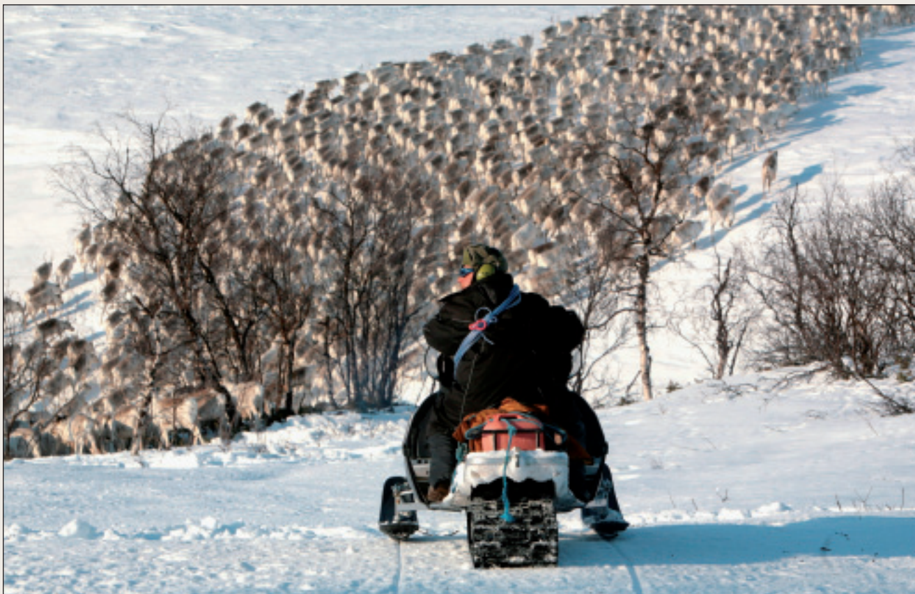
Råvarer fra Finnmark representerer særpreg og mangfold i forhold til tradisjon, kultur, klima, miljø og natur.