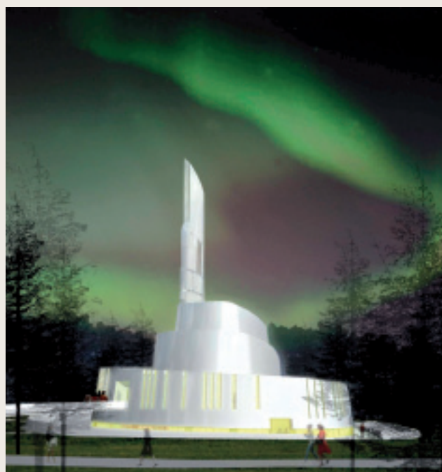
Nordlyskatedralen er under bygging i Alta. Tegning: Link Signatur