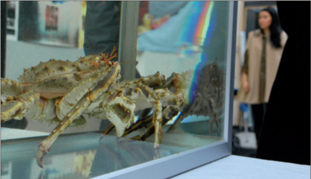
Matfylket Finnmark har fokus på sjømat, jordbruk og reindrift.