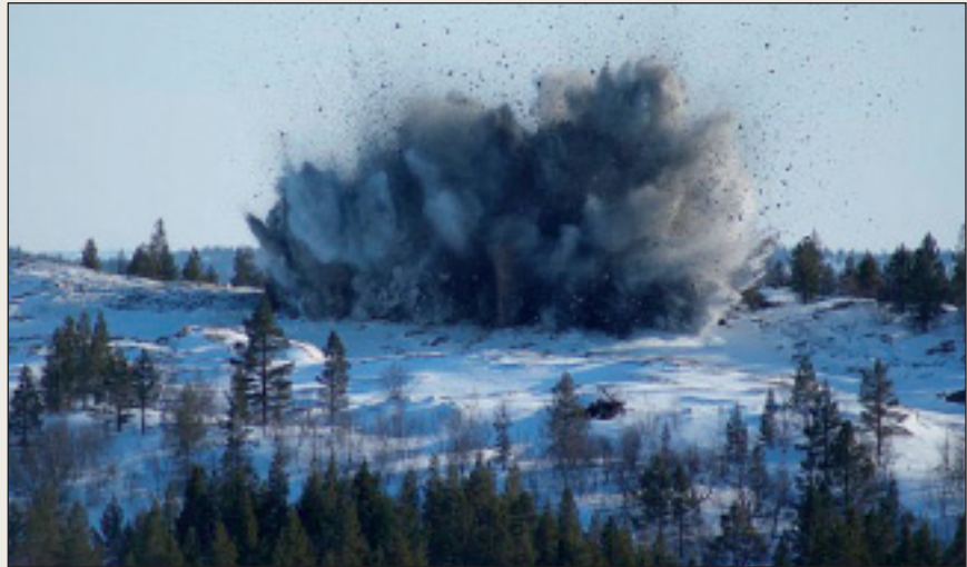
Finnmark er et spennende mineralfylke med store, påviste mineralressurser.

Finnmark fylkeskommune har etablert Mineralforum som samler de sentrale aktørene i Finnmark. En av mål-