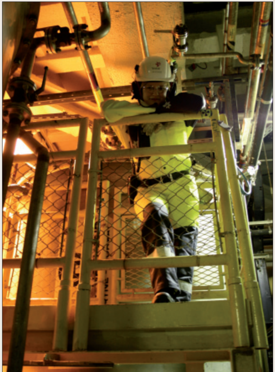
Fagskoleutdanningen skal uformes i nært samarbeid med næringslivet.

Finnmark har i dag en privat tilbyder av fagskoleutdanning som er lokalisert