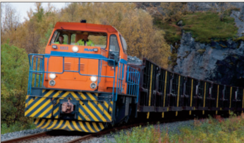
Fagmiljø i Sør-Varanger har startet et forprosjekt for fagskole rettet mot mineralindustri.