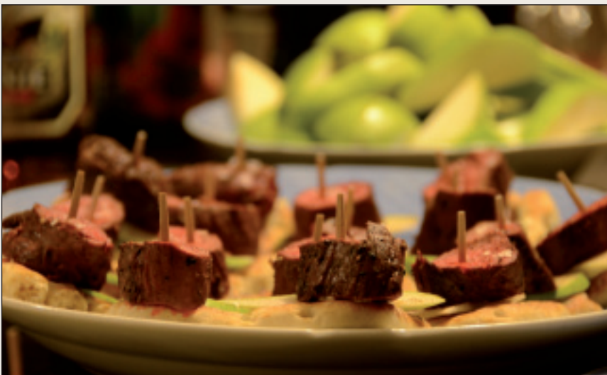
Nye spennende delikatesser laget av reinkjøtt.