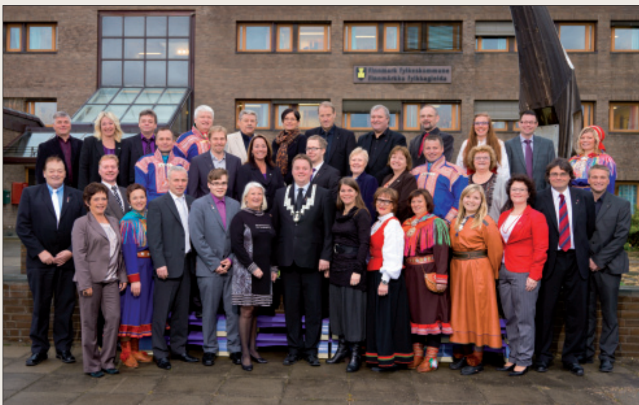
Fylkestinget skal sørge for at det tilbys godkjent fagskoleutdanning innenfor prioriterte samfunnsområder.

Fylkesråden for kompetanse og utdanning avgjør hvilke tilbydere som etter søknad, skal få økonomiske tilskudd.