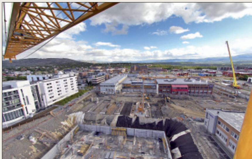
Fagmiljøet i Alta ønsker å starte fagskoleutdanning rettet mot bygg og anlegg.

Fagmiljø i både Kirkenes og Alta har tatt initiativ til forprosjekt, for å avdekke mulighetene for å starte fagskoleutdanning. I tillegg tilbyr