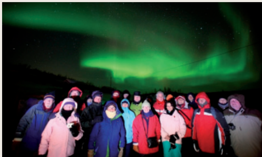
Målet er at Finnmark skal bli ledende innen arktiske opplevelser.

En annen stor del av bransjen er hotell og restaurant. Innen dette segmentet er det både små og store aktører. Det har etablert seg flere nye hoteller i Finnmark, blant annet i Alta og Kirkenes. Bransjen har et stort behov for arbeidskraft, særlig innen yrkes-