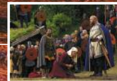
Spelet på Stiklestad