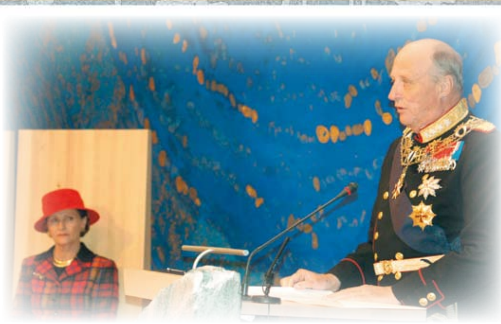
Hans majestet kong Harald åpner det 5. Sametinget 9. oktober 2005.