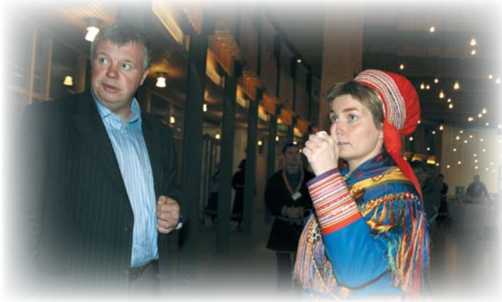
Arbeids- og inkluderingsminister Bjarne Håkon Hansen i Sametinget høsten 2005, blir vist rundt av nyvalgt president Aili Keskitalo.