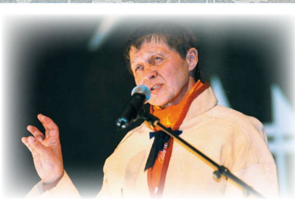
Nils-Aslak Valkeapää (1943-2001) med kunstnernavnet Áilohaš er vel den mest kjente samiske forfatteren. Áilohaš var lyriker, joiker, komponist og billedkunstner.