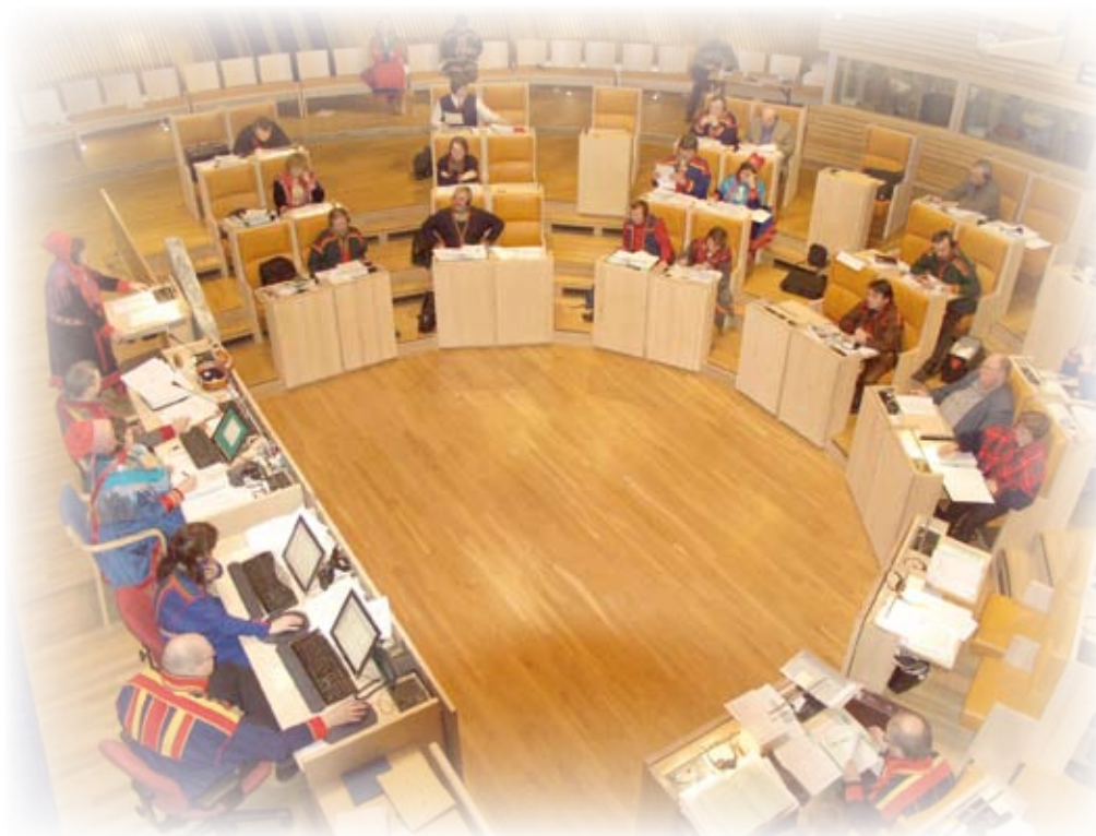
Sametinget i plenum.

Virksomheten til Sametinget er tosidig: (1) tjene som samenes folkevalgte organ og fremme politiske initiativ og (2) ta seg av forvaltningsoppgaver som nasjonale myndigheter eller gitte lover har delegert til Sametinget. Som politisk organ arbeider Sametinget med de saker som tinget selv mener er av særlig interesse for det samiske folket. Sametinget initierer og gjør sitt syn gjeldende i alle saker som er relevante for dets virksomhet.