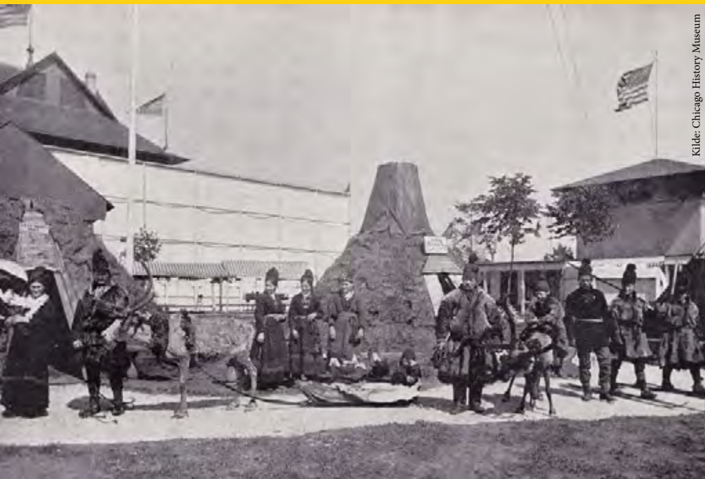
Inne i Lapland Village.