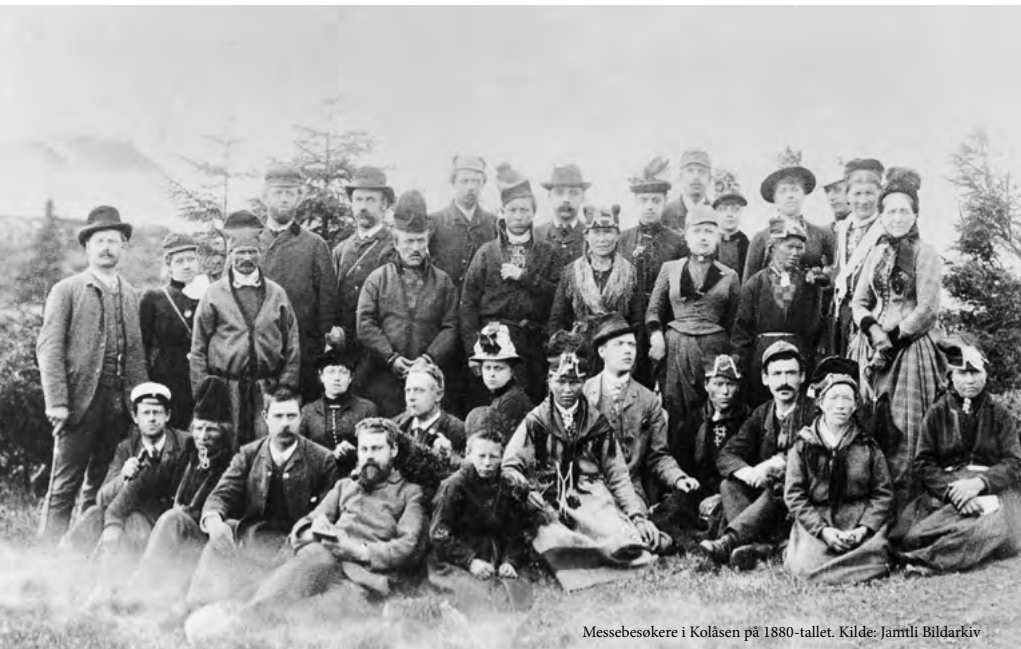
Messebesøkere i Kolåsen på 1880-tallet.