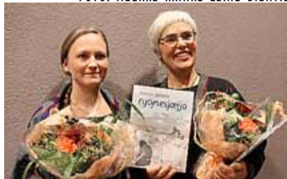
Anne-Grethe Leine Bientie jñh Meerke Laimi Thomasson Vekteli aavoedægan, dej orre gærja lea bæjhkohtamme.

deahpadimmieh tjaelije tjaebpies gie-line buerkeste jñh lohkije maahta sov sjisjnjielisnie vuejnedh guktie dajve váájnoe. Seammasienten gieltegs vaajesem, ñh lohkije tjuara vielie lohkedh, jñh funterde guktie amma daate sjñdta. Jñh guktie Jaahkine gáarede.