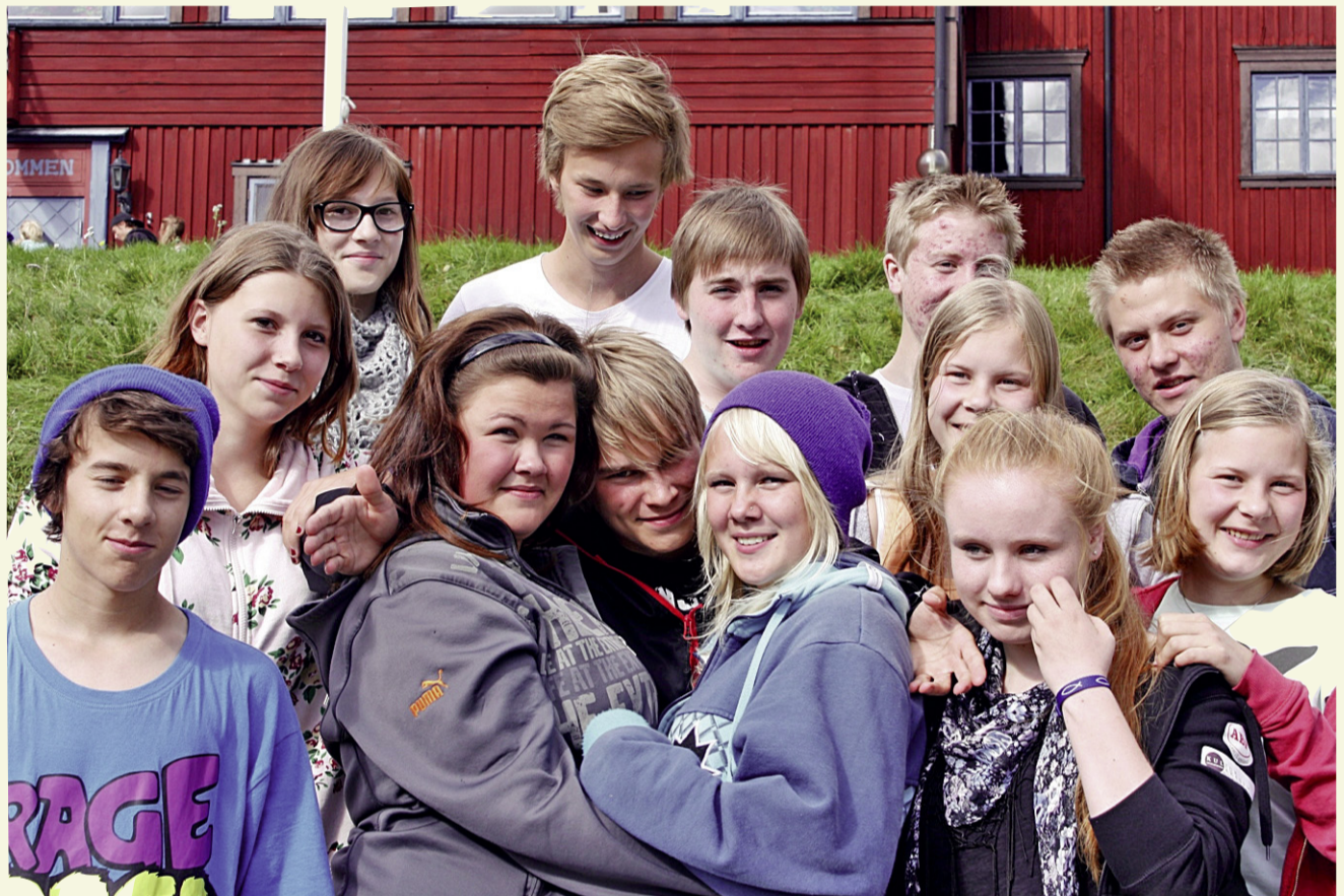
Unga samiska konfirmandledare är viktiga förebilder.

Det samiska konfirmandlägret kommer att förändras.