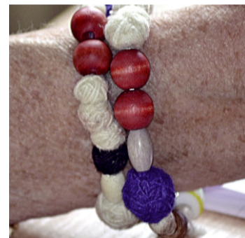
Konfirmandernas samiska frälsarkrans.

– Ett exempel är när jag – det var i början av 80-talet – sprang Lidingöloppet. Jag jobbade på