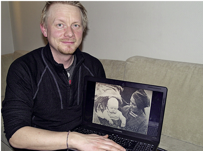
GUVVIE: MEERKE KRIHKE LEINE BIENTIE

Gosse Mattis geerve sjidteme, dellie guarkajahtji aahkebe faamohks j'ih vissjeles nyjsenæjja. Dan fuelhkie badth gieffies, ij dej stoere ealoe. Gosse aahkebe onne lij, dellie derhviegåetesne årroejin. Sigrid skuvesne orriji, sijhti sjovnine hotellesne barkedh. Voestegh Plassjesne barki j'ih dan mænngan Tråantese vöölki. Akten biejjien såangoe-prieviem åadtjoeji. Dallamasten göötide vöölki.