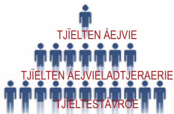
Dah politihkeles áarganh aktene tjieltesne (tjielten áejvieladtjeraerie)

lemielaakan dle tjieltestävroetjáanghkoee ajve ikth asken. Tjieltestävroe dannasinie aktem tjielten áejvieladtjeraeriem veeljie mij daamtajábpoe gaavnesje jñh tjielten barkoem vááksje. Tjielten áejvieladtjeraeresne naan tjieltestävroen líhtsegh. Dejnje jeanatjomes tjieltine dle politihkerh jijtjemse joekedieh politihkeles moenehtsisnie jallh dáehkine, mah diedtem utnieh ovmessie aamhtesi ávteste, v.g skuvle, kultuvre jñh hokse. Tjielte aaj aktem reeremem átna ihkuve bar-kijigujmie. Dihte reereles ávtehke lea raerie-álma.