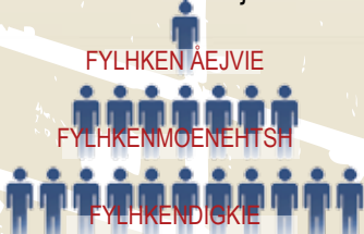
Dah politihkeles áarganh aktene fylhkentjieltesne.

Stuvremevuekie dejnie ellen jeanatjomes fylhkine lea mahte seamma goh tjieltesne. Fylhke fylhkendigkiem átna (seamma goh tjieltestävroe), fylhkenmoenehtse (seamma goh tjielten áejvieladtjeraerie), fylhken áejvie jñh vihties moenehtsh. Hedmaarihke jñh Nordlaante aktem parlamentarihkeles maallem veeljeme.