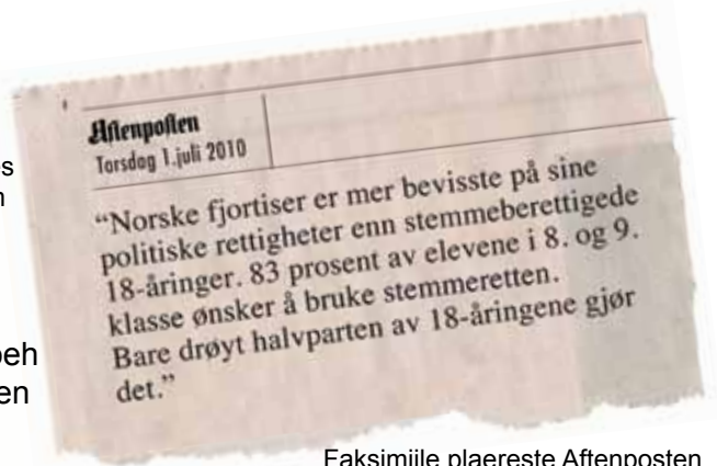
Faksimile plaereste Aftenposten 01.07.2010