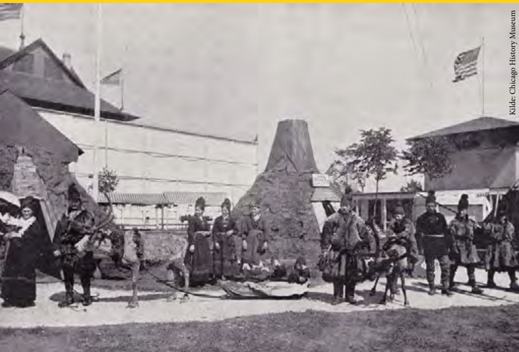
Lapland Village.