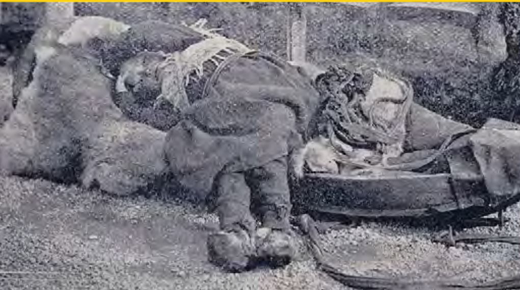
Gaaltje: Chicago History Museum.