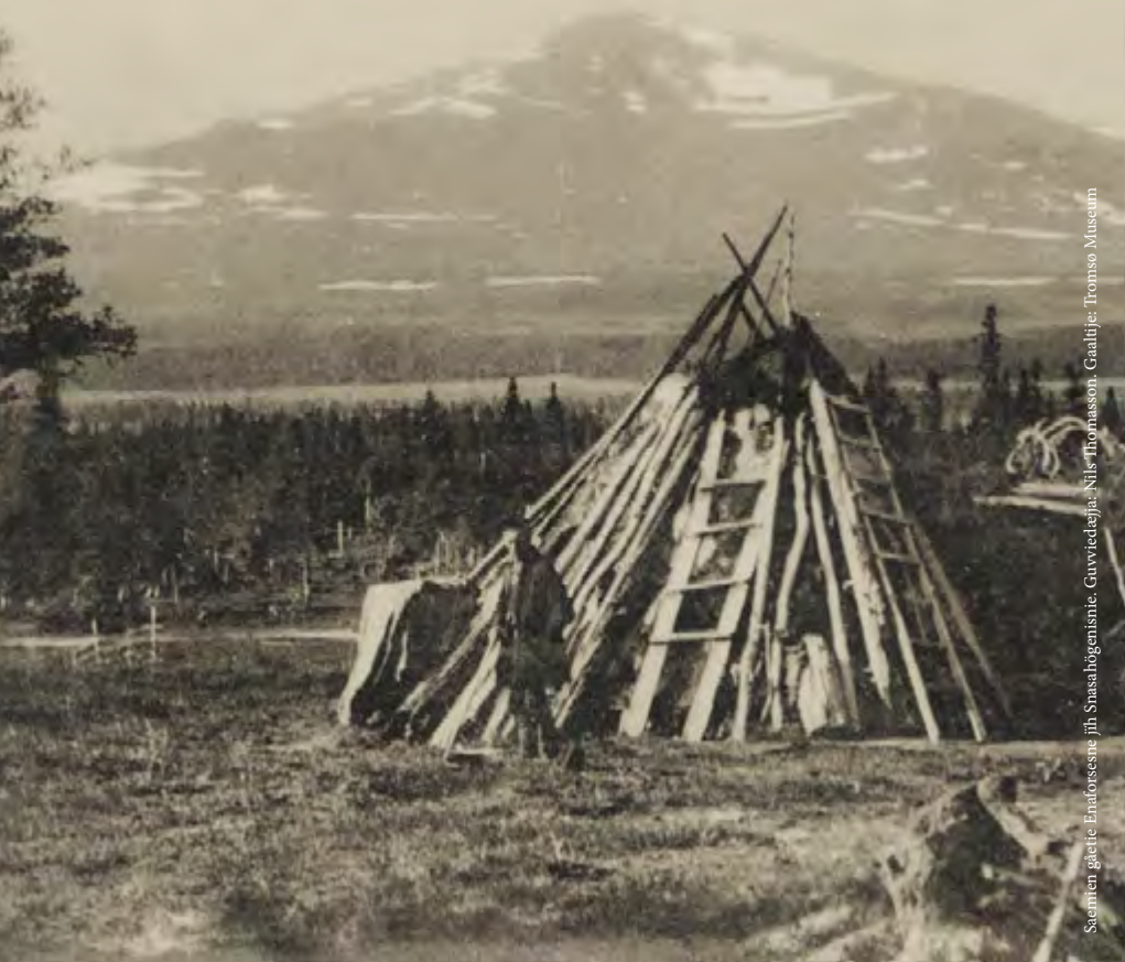
Lappkåta vid Enafors och Snasahögen.