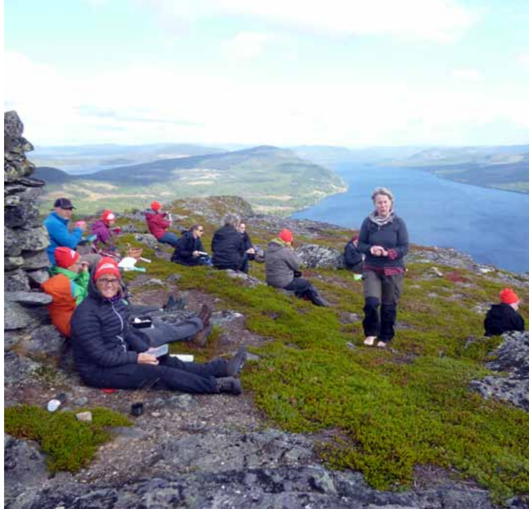
Friskisresa: Ett 30-tal deltagare, många från Stockholmstrakten, deltog i vandringsresan till Frostviken i samarbete mellan South Lapland och Friskispresen.