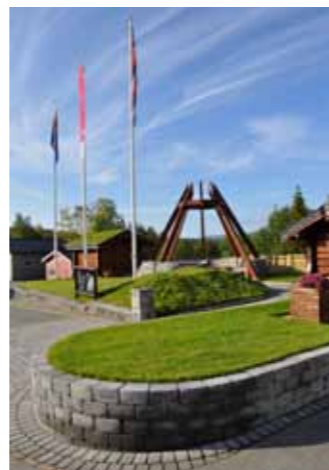
Det nye fjellrevsenteret.