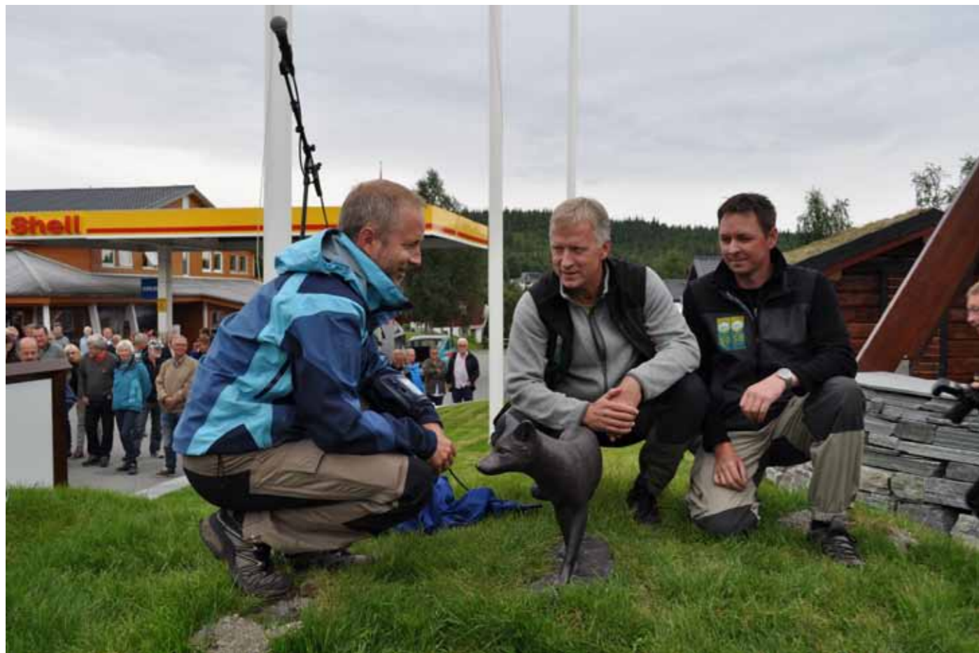
Statsråd Bård Vegard Solhjel avduker en bronsestatue av en fjellrev som symbol på det nye fjellrevsenteret i Røyrvik.