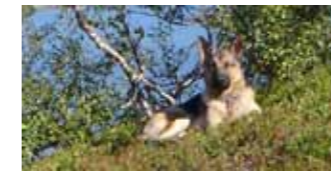
Cæsar med ett vaksomt blick over leiren.