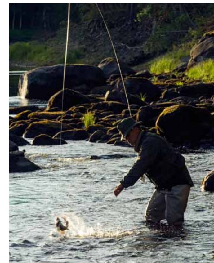
Det finns goda möjligheter för en ny fiskefestival i Vaajma även nästa år.