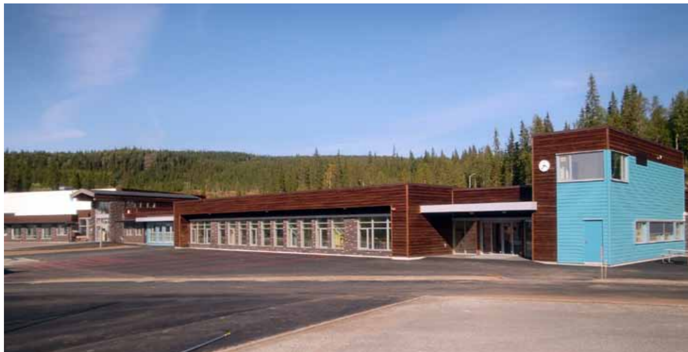
Nyskola på Stortangen i Nordli.