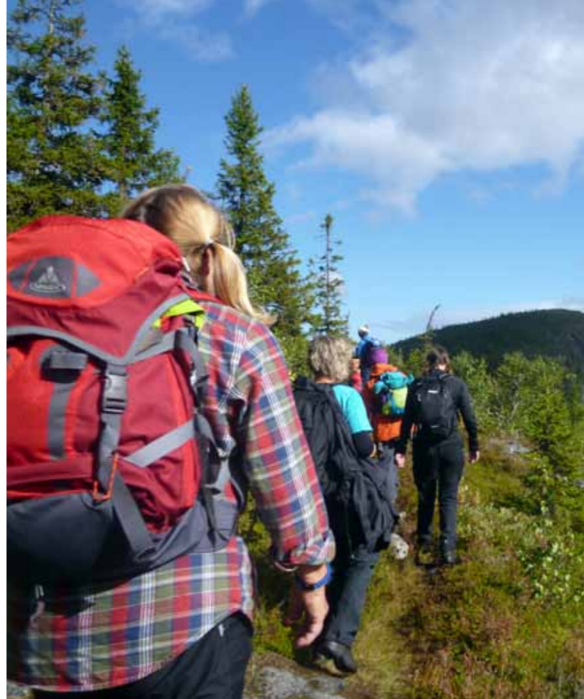
Vidunderlig utsikt på väg upp mot Kalberget.