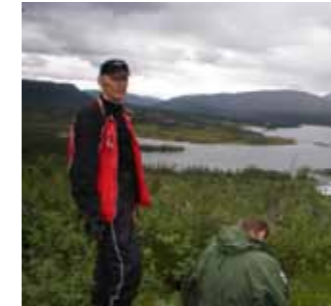
På vei ned mot Virma og Namsvatnet

DET E BØRGEFJELL. Og no start dagen. Du ser deg om, skal du fisk i Djupvatnet, kanskje går turen opp elva, eller kanskje bare rusle rundt, plukk litt bær, slapp av på en tørrabb, eller... Det er det som er så fint, du har den roen som naturen rundt deg gir. En rein som gress ett par hundre meter unna gir deg følelsen å vær nær naturen. Og når det