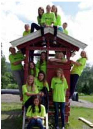
Ett gäng nöjda och glada entreprenörer.