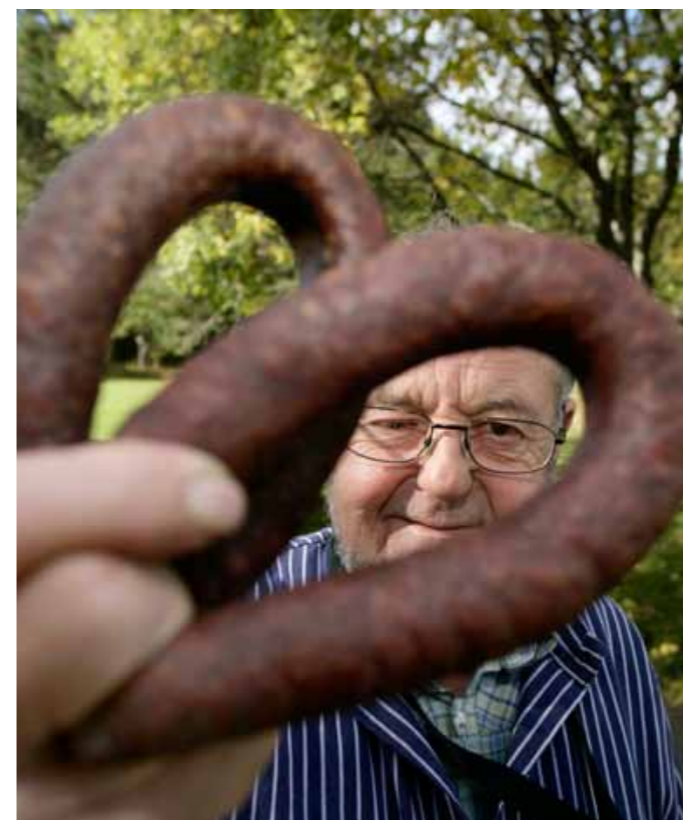
Under 2013 kommer Vaajmas mathantverkare att få visa upp sig under arrangemanget "Kortreist mat i Vaajma".

VAAJMA Ett kulinariskt äventyr i sagans och mytens värld är vad som väntar under fyra dagar i mitten av oktober. Då anordnas nämligen "Kortreist mat i Vaajma" där de många lokala mathantverkarna får stå i fokus.