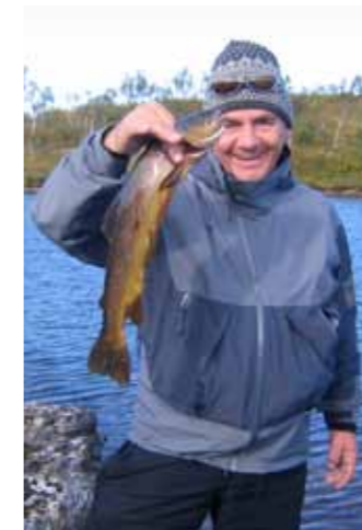
Flott fangst fra Djupvatnet.