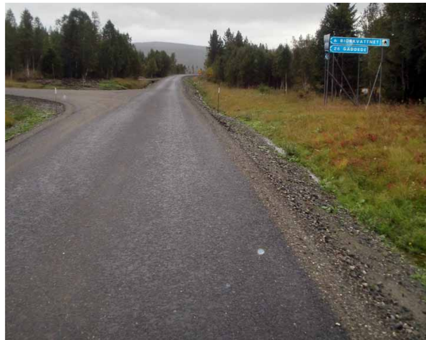
Den "norske" veien som svenskene har rustet opp.