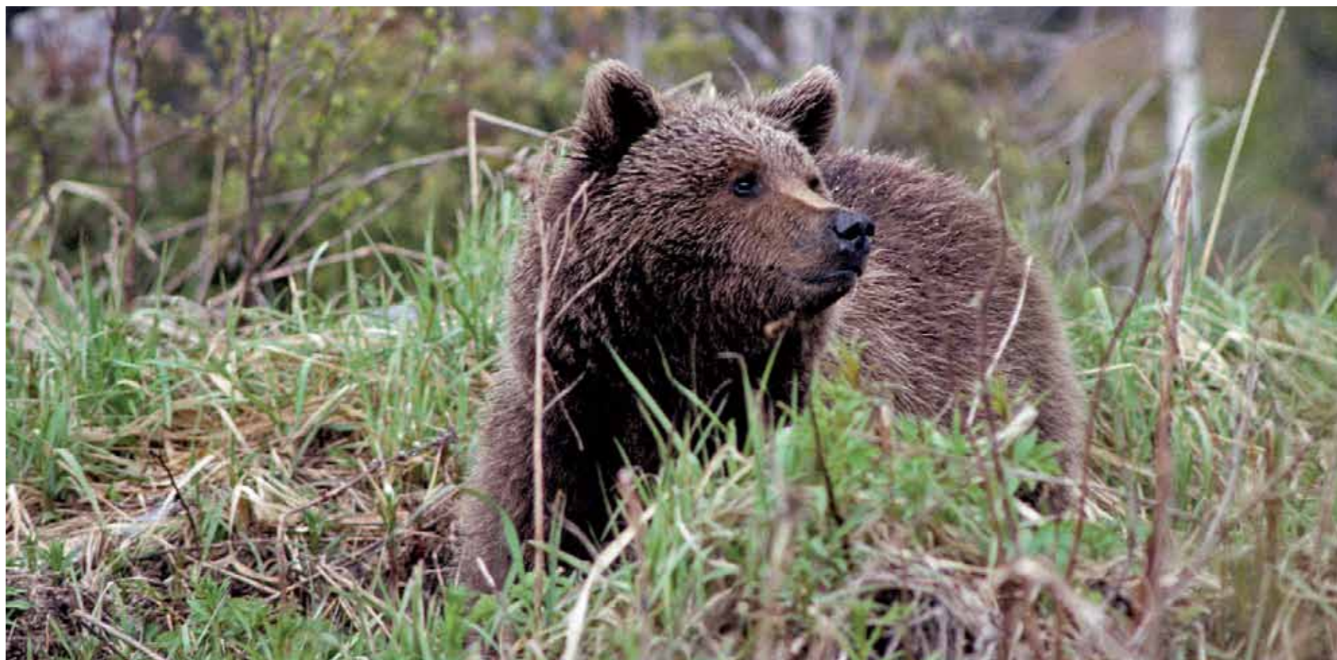
Björnen är ett djur som skrämmer många människor. En del är så rädda att de inte vågar ge sig ut i skog och mark. Ökad kunskap och mer erfarenhet kan minska rädslan.