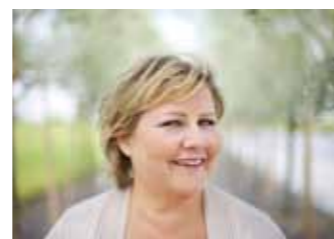
Erna Solberg.