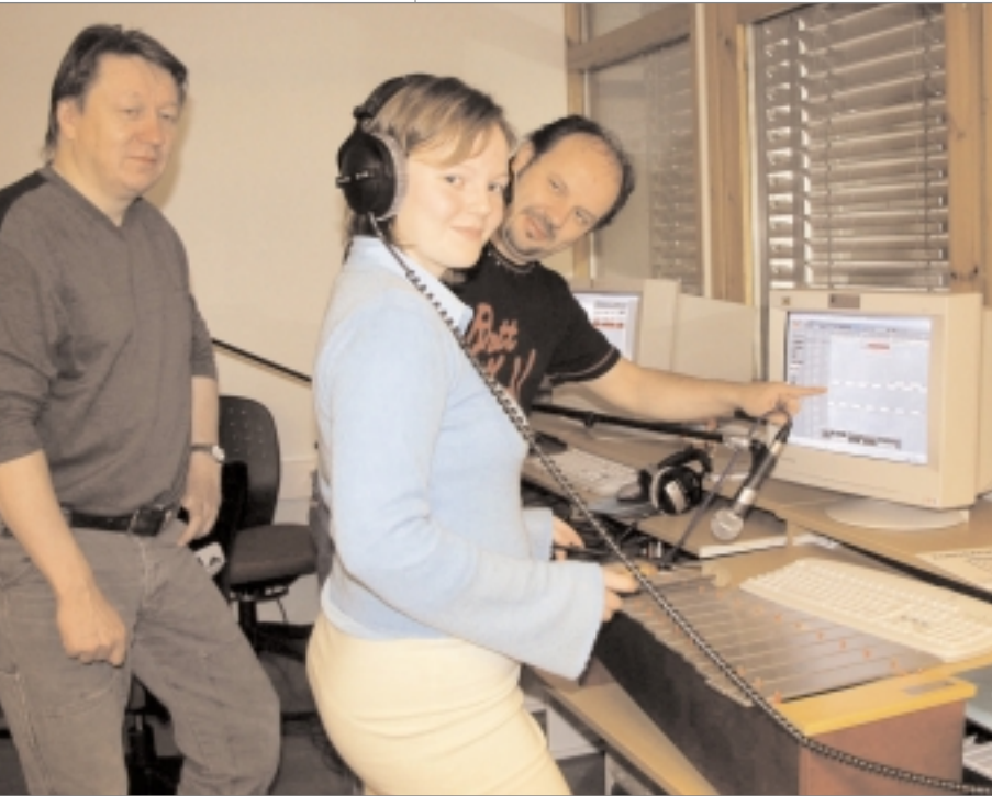
Govvideaddji: Ammun Joonskareng

Åarjel-Saemiej skuvle 7760 Snåsa Tlf: 74 13 84 50 Telefákssa: 74 13 84 51 http://www.snasa.kommune.no/sorsamisk/sameskolen