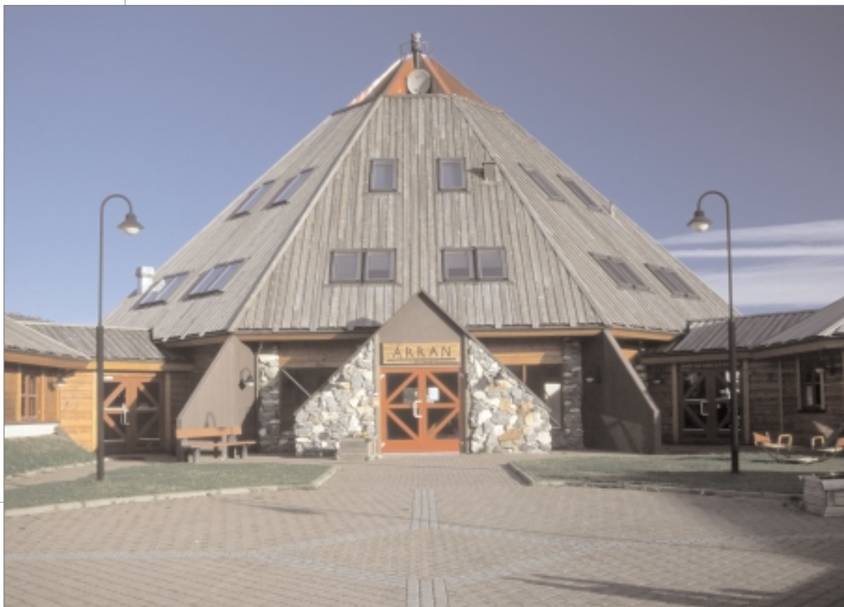
Árran Julevsámi kulturguovddáš Ájluovttas, Divttasvuonas. Doppe lea e.e. NRK Sámiradios kontuvra.

Giellaguovddážiin leat olu iešguđet lágan barggut ja doaimmat. E.e. sii barget skuvllaid ektui, ja juhket dieđuid sámi diliid birra, ja sii ovttasbarget báikkálaš sámi ásaheiguin ja organisašuvnnaiguin, ja oassálastet fierpmá- dagain ovtta guovllu sámeigeloahpahead- djiiguin, ja sii lágidit kuršaid ja muđuid stuora ja smávva dáhpáhusaid. Dávjá doibmet giel- laguovddážat maid dakkár báikin gos buolv- vat besset deaivvadit. Eanaš giellaguovddážat barget ovtta olu gielddai- guin, muhtimat maid mánja fylkkaiguin dahje mánja riikkaiguin.