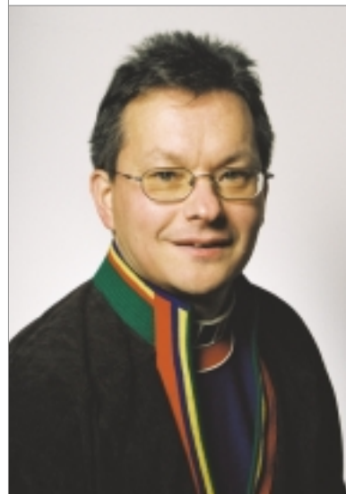
Sámediggepresideanta Sven-Roald Nystø