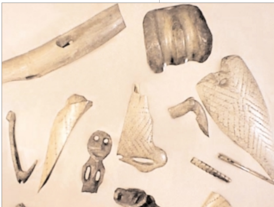
Govvideaddji: Varanger samiske museum

Várjjat Sámi Musea Inggágoahti 9840 Vuonnabahta Tlf: 78 95 99 20 Telefákssa: 78 95 99 30 E-poasta: info@varanger-samiske.museum.no http://www.museumsnett.no/vsm