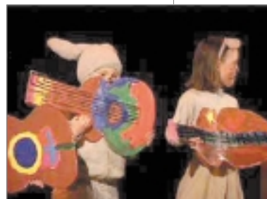
Govideaddji: Karasjok kulturskole