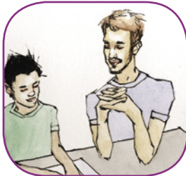
1: Oahppi ja oahpaheaddji/ráhkkanepmi

Sihkkarastin dihtii buori ovttasbarggu, de sáhtášii ovdánanságastallan leat ovdamearkka dihtii váhnenčoahkkimis fáddán. Doppe sáhttet sihke oahpaheaddji ja váhnemat árvalit mii ságastallamis galgá dáhpáhuvat. Oahpaheaddji sáhtta maiddái sáddet ságastallančálloso masa váhnemiid hástala čállit daid áššiid maid háliidit váldit ovdan. Go oahpaheaddji oažžu čálloso ruovttoluotta, de sáhtta sisdoalu heivehit juohke ságastallamii.