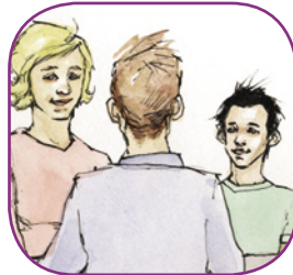
3: Ovdánanságastallan, masa buohkat leat bures ráhkkanan.

Sáhtta maiddái leat ávkkálaš jearahit váhnemiid ovdánanságastallama birra. Iskkadeamis sáhtta ovdamearkka dihtii jearrat: