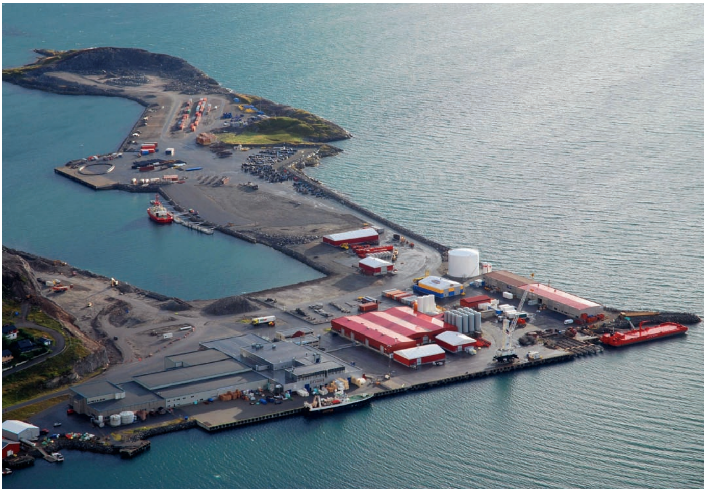
Polarbase Hámmarfeastta olggobealde.

Ovdaprošeakta «Finnmárku industriija ealáhusstrategalaš lávdin» lea álggahuvvon árvvoštallat fylkkagiellada viidásat rolla industriijavejolašvuodaid strategalaš ovdánahttimis fylkkas ja mat leat čadnon oljo-/gássa- ja Shtokmannhukse-miidda.