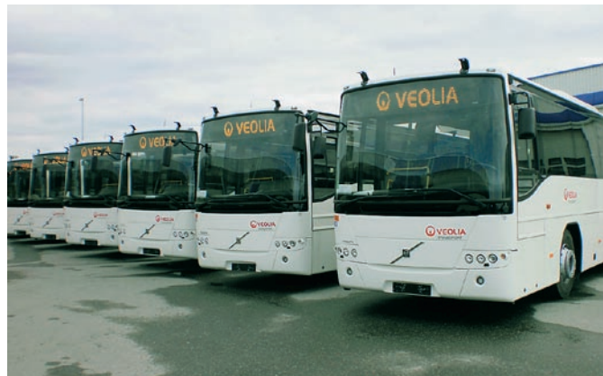
Áiddo ostojuvvon busset.

bargovejolašvuodaid mat bures ovdánit, ja gokčat ealáhusaid fievrridandárbbuid