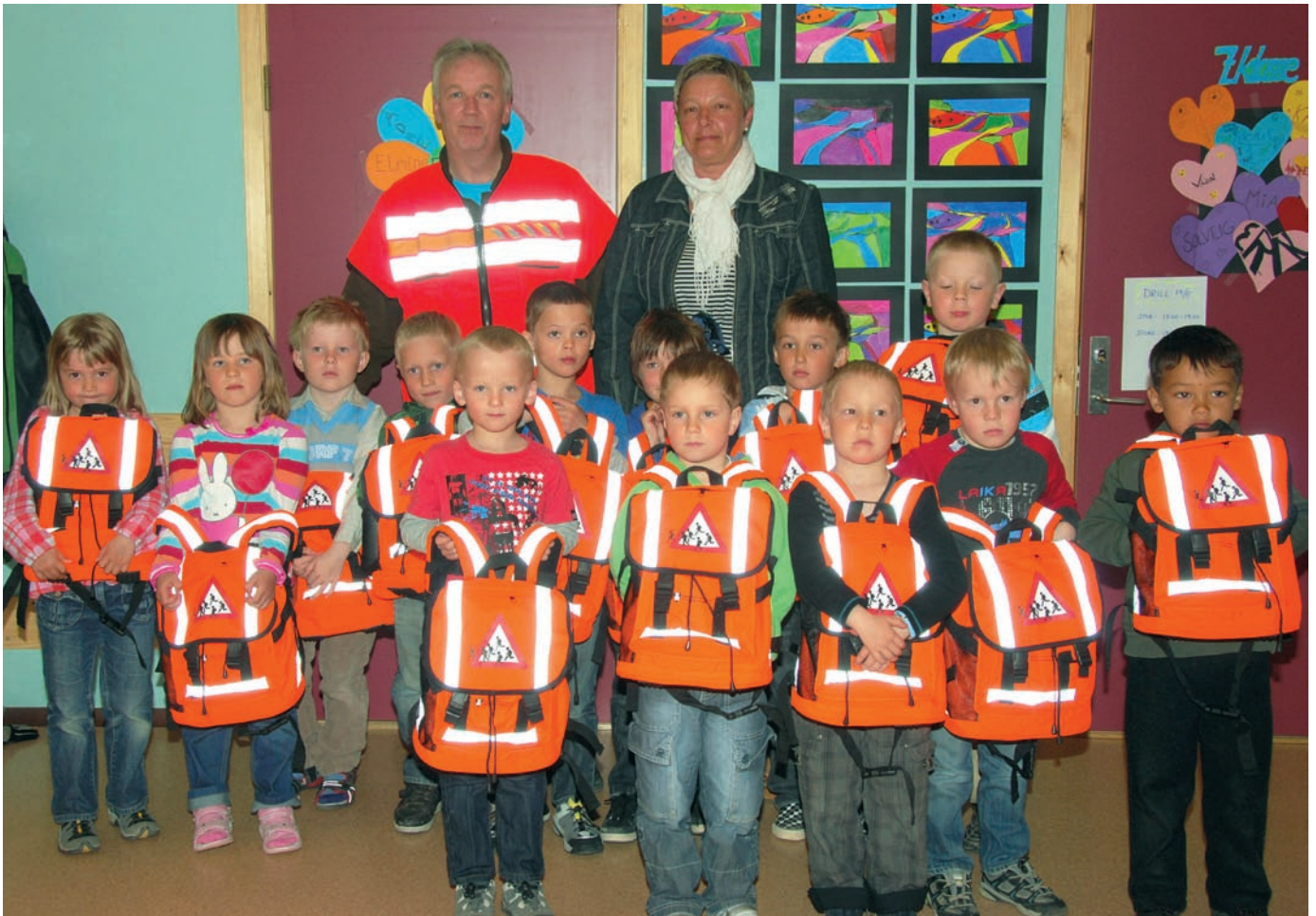
Skuvlávkkaid juohkin ođđa 1.luokkálaččaide.

Johtolatsihkkarvuoda barggus lea fágalaš fierpmádat dehálaš mii doaibmá formálalaš ja eahpeformálalaš oktavuodain. Dán hálddaša dálá TS-forum.