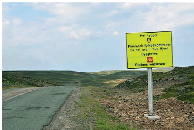
Finnmárkku fylkkagiella huksemin ođđa geainnu Idjavuonduoddari.

Našuvnnalaš johtaluspolitihkalaš vuoruheamit leat mielde Finnmarkku Guvllolaš johtalusplána, ja dat váikkuhit fylkkagiella johtalus ovddasvástádussuorgái. Danne leat plána mielde ángiruššansuorggit gos mángasis lea ovddasvástádus. Plána sisttisoallá dehálaš mihtto-meriid ja ángiruššansurggiid, ee kollektiivalaš johtolatbálvalusaid oastimiid, fylkkageainnuid ja riikkageainnuid ovdánahttin doaimmaid, hámmanhuksejumiid ja johtolatsihkarvuoda.