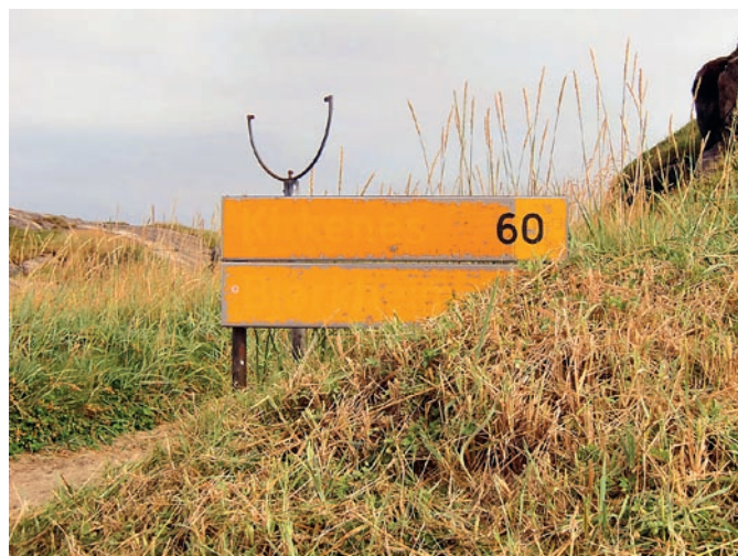
Fylkkegeainnuid váilevaš divodanbarggut, fg. 886 Vuorján.

Lea dárbu jahkásaš ekonomalaš rámmii mii lea unnimus 60 mill.kr buoridit geainnuid mat leat sakka billašuvvan ja hehttet huksehusaid ja dehálaš fylkkageainnuid billašuvvamis.