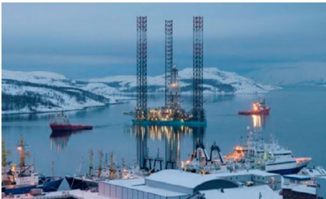
Girkonjárgga hámmán.

Ráđđehus lea nannosit ángiruššan davviguovlluid politihkalaš doaimmain. «Ođđa huksengeađggit davvin» mii álmuhuvvui njukčamánu 2009, álmuha višuvnnaid davviguovlluide ja vuordámušat leat ahte fylka dál buorebut vuoruhuvvo. Finnmárkku fylkkadikki mielas lea ráđđehusa davviguovlopolitihkka našuvnnalaš ovdánahttinprošeakta, ja fylkkadiggi