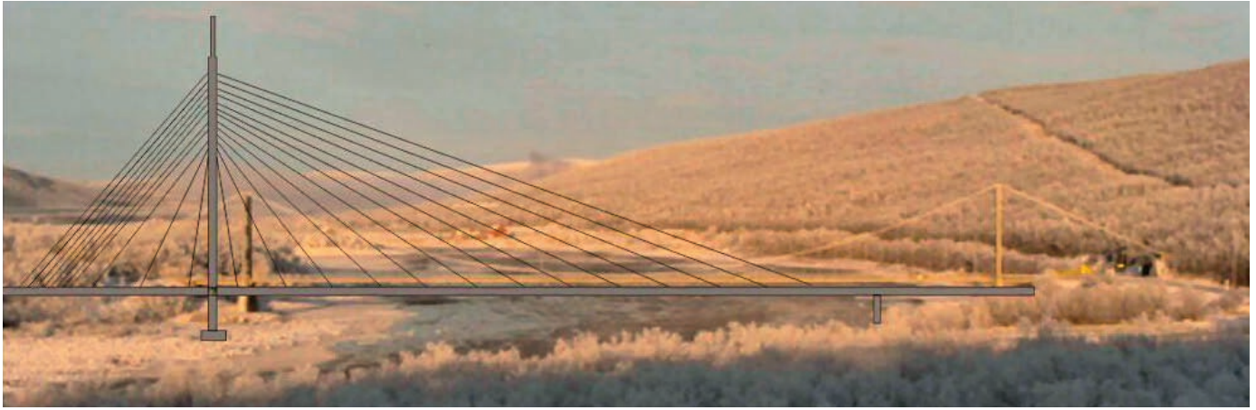
Evttohuuvvon odđa šaldi Deanušalddis.