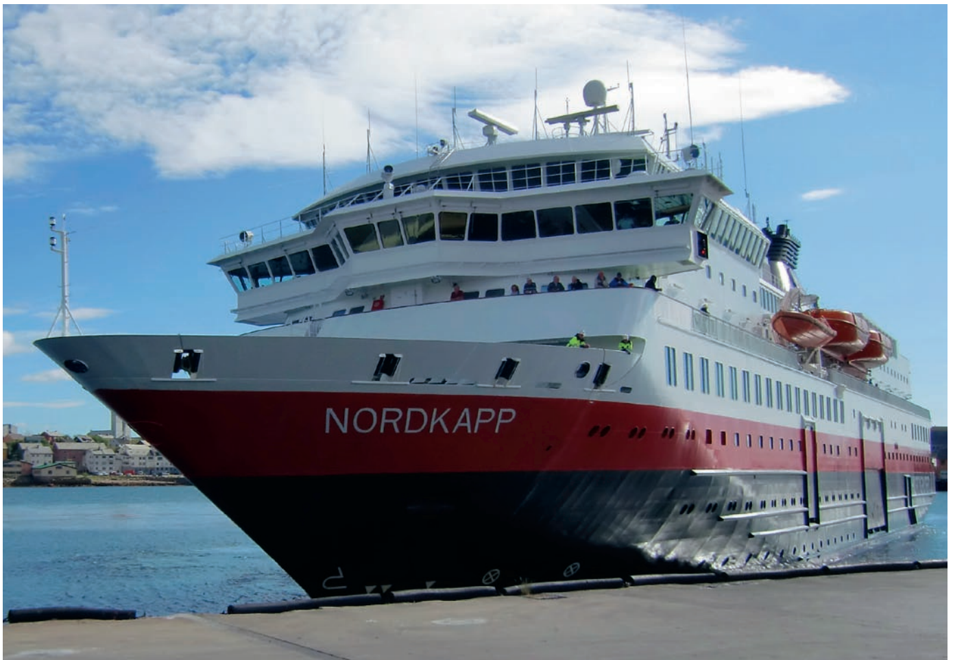
Ruktu Čáhcesullos.

Muhtun áiggiid, erenoamážit Nuorta-Finnmárkkus, lea dájvá nu ahte ruktu (hurtigruta) ii sáhte borjjastit hámmaniidda. Dát dagaha eahpesihkarvuoda ruktu návccaide leat fievrridangaskaoapmin, ja sáhtá dagahit ahte olusat eai vállje johtit dan mielde. Seammás hámmanat masset sisabođu eretcealkimiid geažil. Dát váikkuha fas ahte šaddá váddásat ortnegsdoallat buriid ja dorvolaš hámmaniid ee. ruktuid borjjastemiide. Dát buktá maiddái váttisvuodaid doalahit stádis bálvváid hámmaniin. Vurdojuvvo ahte dát áššit guorahallojuvvojit ja čielggaduvvojit vai ruktu ain boahtteáiggis lea oadjebas ja dorvolaš fievrridangaskaoapmi riddoguvllu doaimmaid várás.