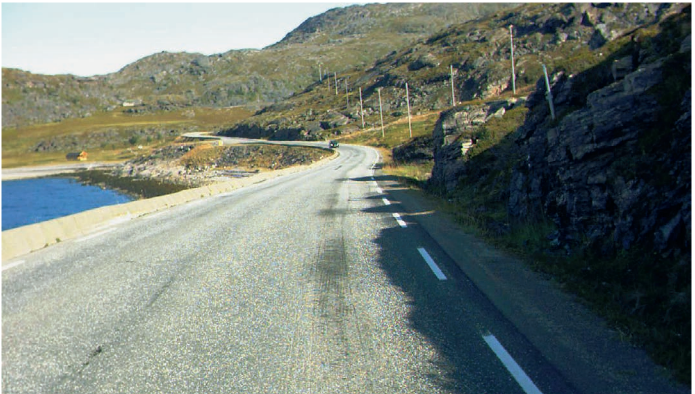
Rg. 94 Skáidi–Hámmarfeasta.

Deháleamos vuoruheamit Finnmárkku riikkageainnuid okta-vođas leat buoridit dálá geainnuid ja unnidit uđas váralaš-vođaid.