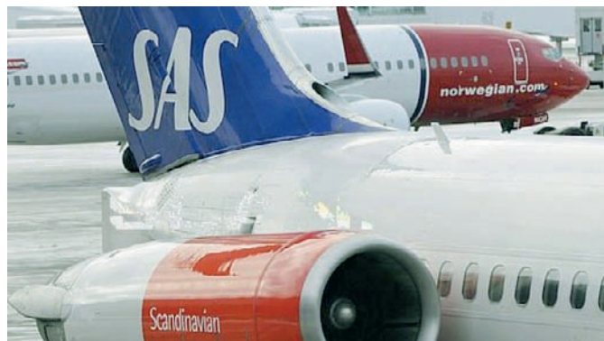
SAS ja Norwegian.

Gir dijohtolat lea njiedjan jagi 2008 loahpa rájes. Vurdojuvvo ahte njiedjan joatkkašuvvá vel moadde jagi plánaáigodagas. Finnmárkku gir dišilju leat daid manjimus jagiid ožžon olu ruhtadoarjagiid investeremiidda, vuosttamužžan lea sihkarvuohta birra gir dišiljuid buoriduvvon. Odđa terminála ráhppojuvvui Girkonjárggas 2006:as ja viiddiduvvui manjil.