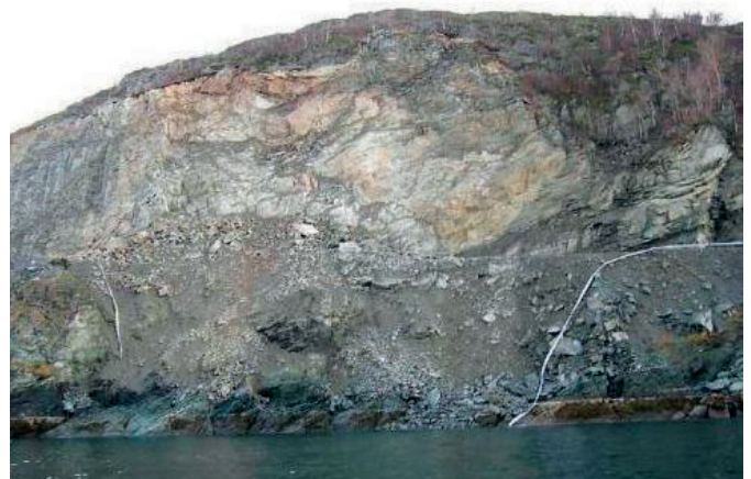
Fylkkageaidnu 19 – Liidnavuonna, geađggit fearran geainnu ala.