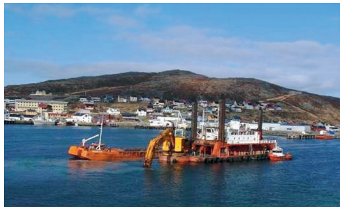
Mohtten Ávanuoris.

Doaibmajut eará guolástushámmaniidda ja golut áigodagahii 2014–2019: Báhcavuonas leat plánejuvvon mohttendoaimmat ja Bearalvágis fas viiddidandoaimmat maŋgil 2014. Doaibmajut Smiervuonas (Porsánnguvuonas) lei mielde jagiid 2006–2015