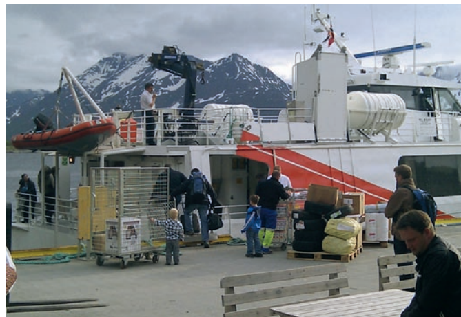
Vuolginin Mårøy fatnas mielde.

Heivolašvuohhta buohkaide lea láchkavuoduštuvvon diskriminerings- og tilgjengelighetsloven nammasaš lágas mii fápmuduvvui 01.01.2009. Lága ulbmilin lea ee. sihkarasit ahte buohkat min servodagas galget oázžut seammá árvosaš vejolašvuodaid ja vuoigatvuodaid, sorjjasmeahtumin doaibmannávccaid. Finn-márkku fylkkagiela lea álggahan barggu, ja lea ee. almmuhettiin fálaldatgilvohallama Gaska-Finn-márkkus gáibidan ahte busset galget heivehuvvot buohkaide. Go ođđa ráhkadusat dinggojuvvojit, de galget dat heivehuvvon vai buohkat sáhttet fievrriidánráhkadusaid geavahit. Fylkkagiela áigu dán áigodagas ovtta Stáhta