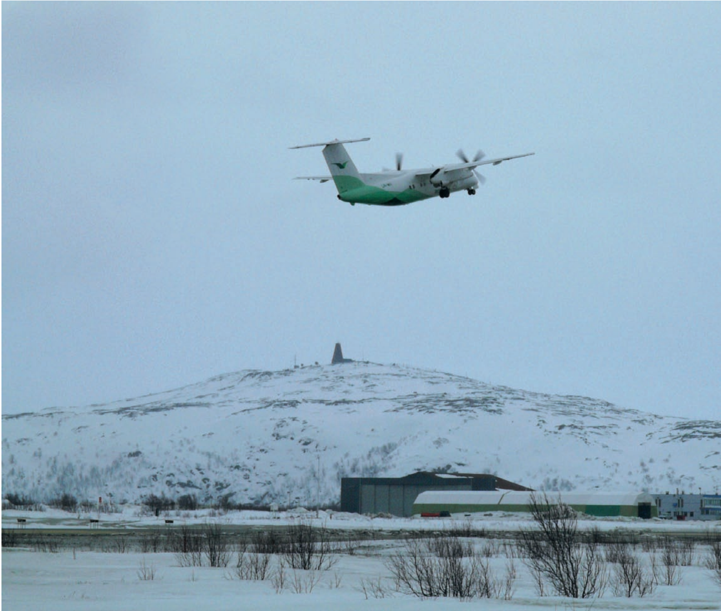
Girdi lohtana Girkonjårgga girdišiljus.

Girdiruvtto gaskal Girkonjårgga ja Murmánska lea geahč- čaluvvon mángga geardde. Widerøe girddii dán guovllus, ja ruvttu heaittihuvvui beannotjagi maŋŋá sivas uhcán mátkkošteddjiid. Dál girdá Aeroflot Nord gaskal Romssa– Murmánska. Norwegian pláne álggahit ruvttu gaskal Oslo ja Murmánska. Danne ii oro dárbu álggahit ođđa ruvttu boahttevaš áigodagas.