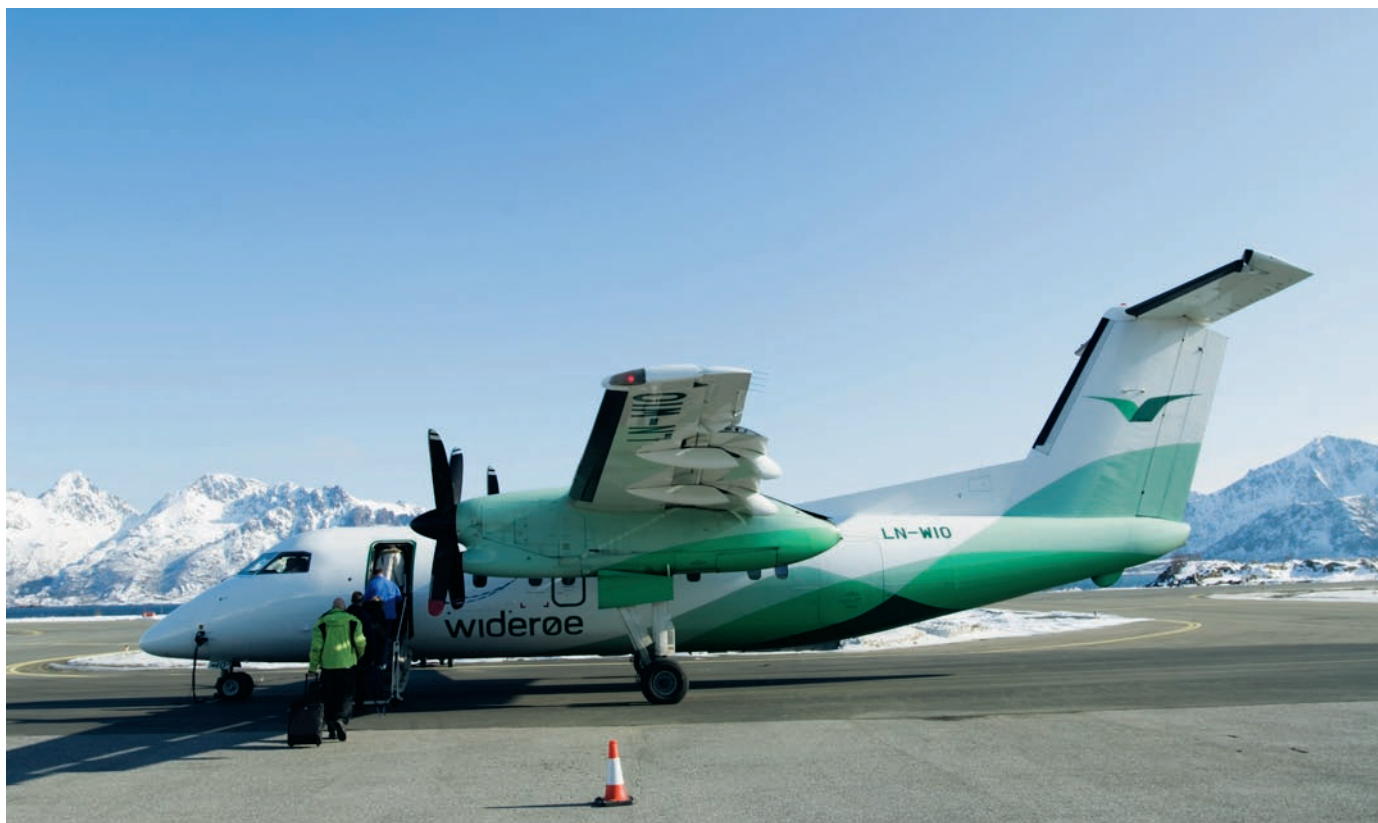
Mátkkošteaddjit mannamin Widerøe 100 girdái.