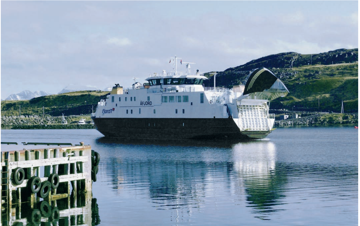
Fylkkageaidnofearga Åfjord.

Áigodaga 2010 – 2013 ekonomalaš rámmat smávit investereimidda: