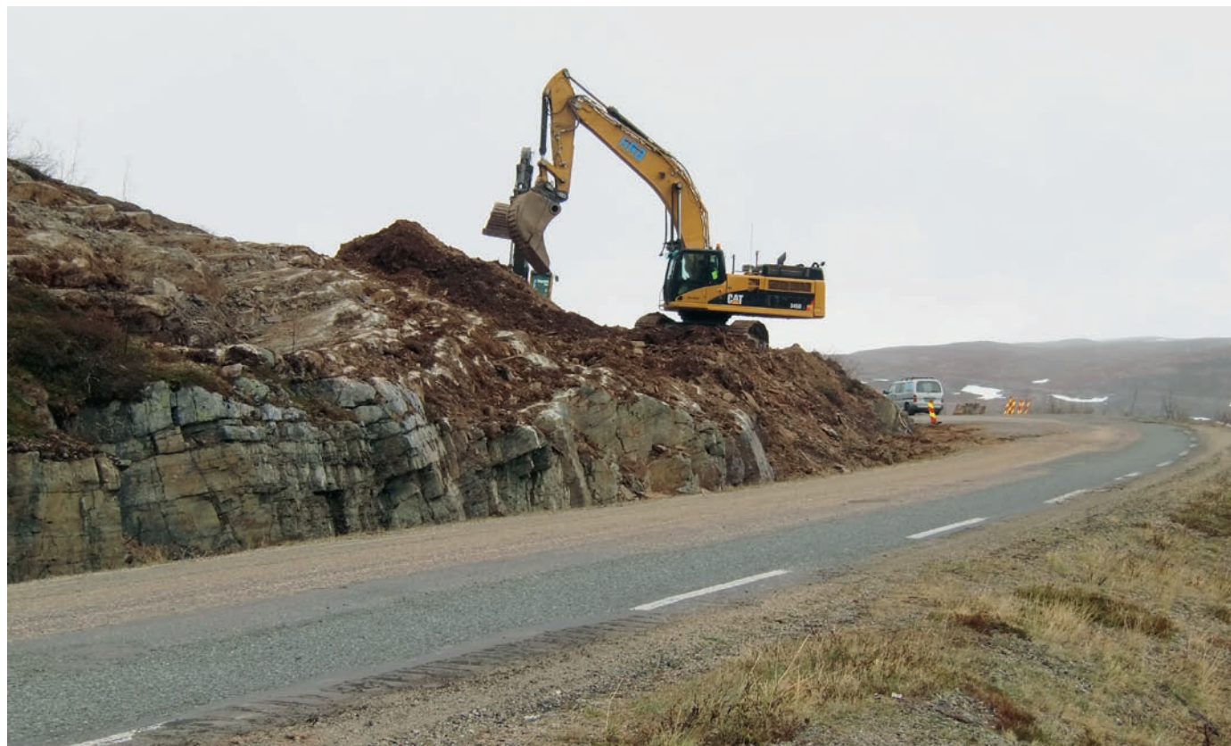
Ráhkkaneamin bávkalit Idjavuonduoddaris.

Árvoštallamat leat maid váldán vuhtii ekonomalaš rámmaid hehttet fylkka biillageaidnofierpmádaga billašuvvamis. Investeremiid, doaimmaid ja divodemiid vuoruhemiid vuodđun leat strategalaš láidesteamit. Dás oaivilduvvo fáhkkašlaš dáhpháhusat mat gusket sihke investeremiidda ja divodemiide ja ekonomalaš čanastusaide mat leat šiehtaduvvon doaibmašiehtadusain ja eará ortnegisdoallan šiehtadusain. Jagi 2010 rámma lea oktiibuot 244,8 millijovvna kruvnnu.