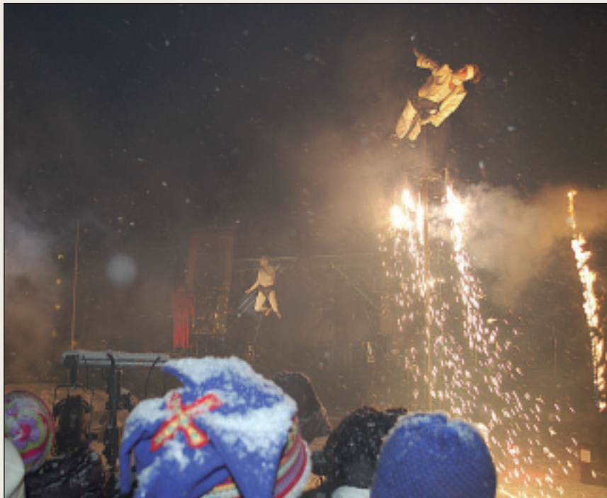
Kulturealáhus sakka ovdána internašunálalaččat ja Norggas.

Dakkár fágaskuvllas sáhtta leat oalle viiddis rekrutterenvuodđu. Sáhttet leat ásaiduvvon fitnodateiiggádat geat oidnet dárbbu eanet gelbbolašvuhtii, dahje oahppit geat aitto leat geargan joatkkaskuvllas, áinnas hutkás fágaiquin