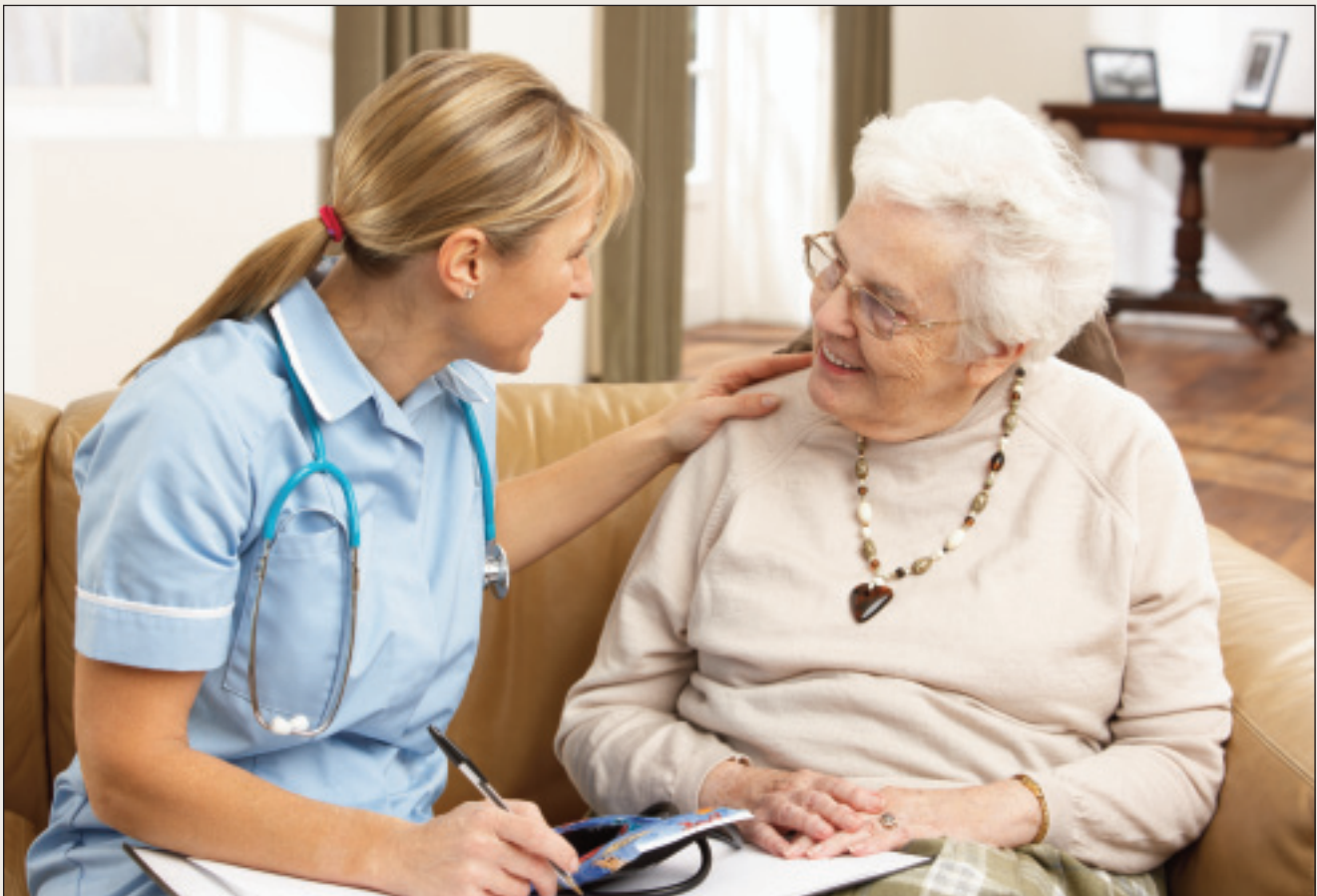
Bisuhan dihtii buriid gieldda- ja spesialistadearvvašvuodafálaldagaid lea áibbas dárbbaslaš ahte eanebut váldet oahpu.