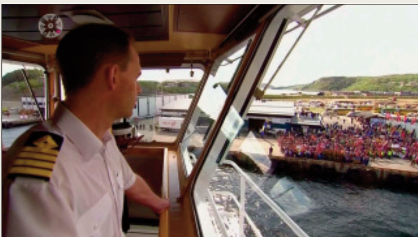
TV-dokumentára "Hurtigruten minutt for minutt" lihkustuvai bures.