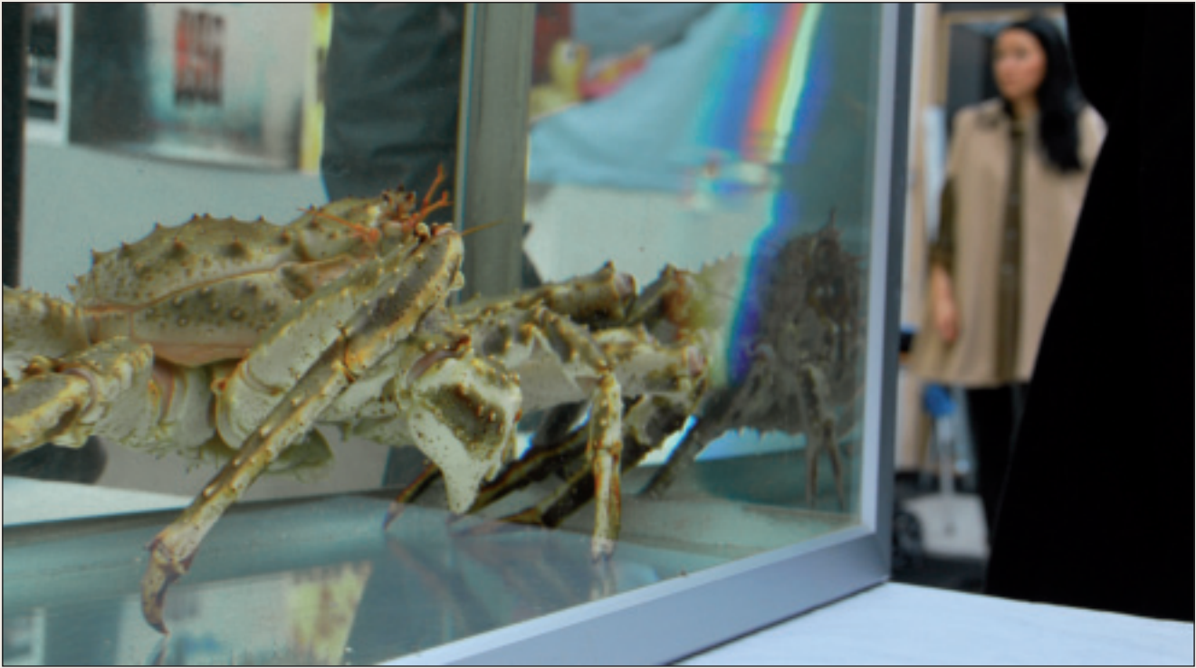
Borramušfylka Finnmárku vuorua mearraborramuša, eanandoalu ja boazodoalu.