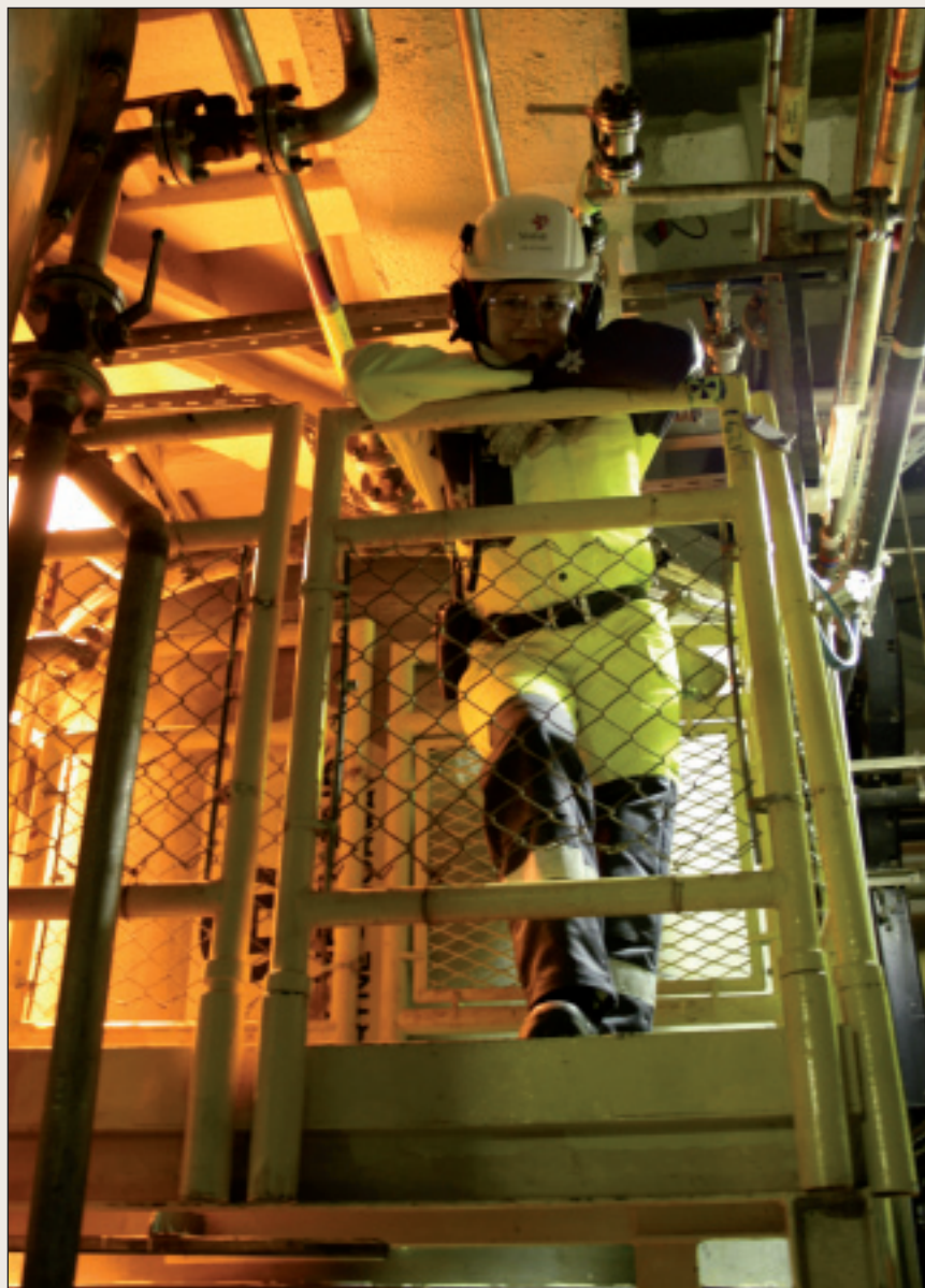
Fágaskuvlaoahpahuš galgá hábmejuvvot lagas ovttasbarguin ealáhuseallimiin.

Finnmárkkus lea dál priváhta fágaskuvlaoahpuid fáluheaddji dáppe fylkkas.