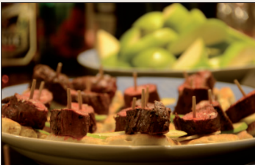
Ođđa gelddolaš herskot ráhkaduvvon bohccobierggus.