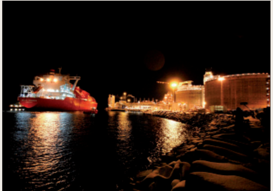
Hámmarfeasttas leat bargosajit energijasuorggis sakka lassánan Snøhvituksema geažil.