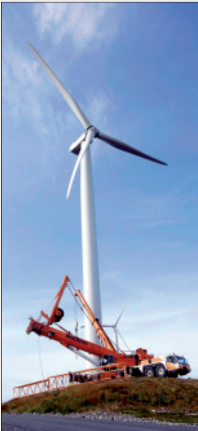
Finnmárku lea buoremus vuolggasadjin nannánvuodot bieggafápmui Norggas.

Finnmárkkus leat stuora vejolašvuodát energijabuvttadeami dáfus ja dan gullelaš ealáhus- ja industrijadoaimmas. Fylkka ođđa energijastrategijja nanne ođastahtti energijja leat váldovuoruhansuorgin ovtadássásaččat petroleasurggiin. Finnmárkkus lea buoremus eavttut Norggas bieggafápmui nannámis, dasa lassin go lea vejolašvuolta buvttadit fiervá- ja ullifámu. Petrolea bealis lea Snøhvitguovlu doaimmas ja nuppi muttu (toga 2) leat pláneme. Lea mearriduvvon ahte Goliatguovlu galgá huksejuvvot ja operatvevra ENI Norge pláne álgit 2013:s. Okta dain stuorámuš hástalusain lea ovdánahttit ođđa gelbbolašvuoda ealáhusaide vai sii sáhttet ávkkástallat gávpevejolašvuodaid mat gullet dán ođđa industrijii (gč. ROP 2010 – 2013).