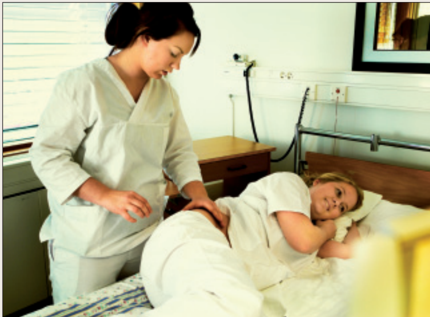
Fágaskuvlafálaldat dearvvašvuoda ja sosiálafágain lea našunála ángiruššan.

Dearvvašvuoda ja sosiálasuorgi lea stuorámus ealáhus Finnmárkkus ja doppe barget dál 7-8000 olbmo. Suohkaniid geavaheaddjiguvllot dikšo- ja fuollabálvalusas váilu 42% bargiin relevánta oahppu. Dasa lassin leat ollugat badjel 55 jagi ja sis ii leat šat guhká bargat. Lea oahpes ášši ahte earenoamážit veahkkedivššárat penšunerejuvvojit árabut dan lossa barggu geažil. Lea hui dehálaš oážžut sin bissut guhkibut barggus. Lea áibbas