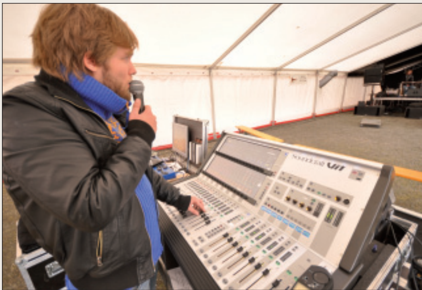
Mihttomearrin lea 500 kulturbargosaji Finnmárkkus.