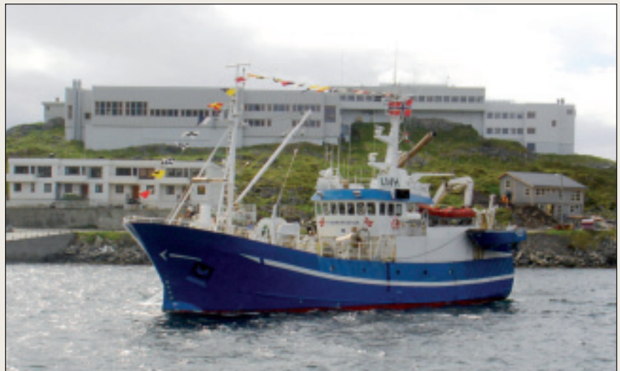
Davvinjárgga maritiibma fágaskuvlla ja joatkkaskuvlla duogábealde oainnat guollebivddu Finnmarkus.

Vuolábealde govus čájeha movt fágaskuvlaoahppu lea sajastuvvon norgga oahppovuogádkii. Fágaskuvlaoahppu lea earálágan go eará alit oahppu earret eará daningo