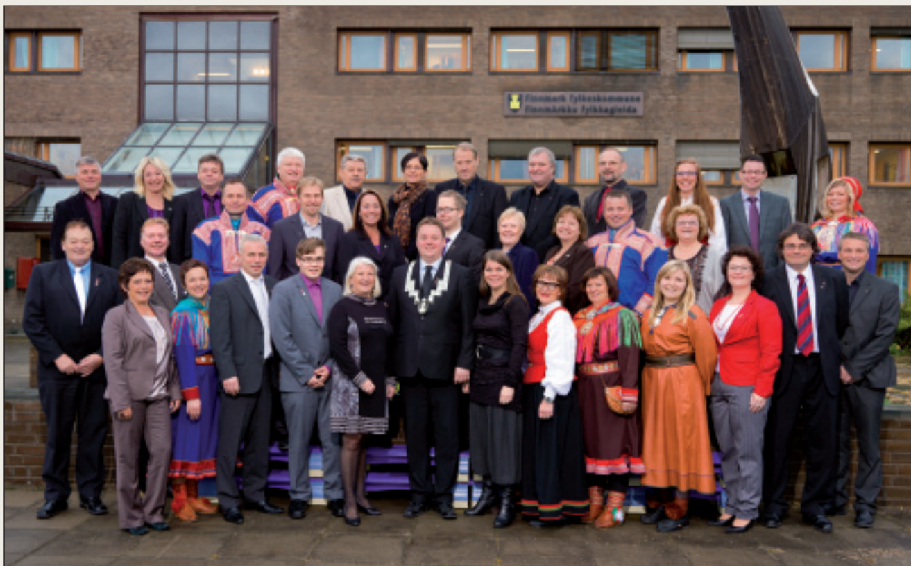
Fylkkadiggi galgá fuolahit ahte dohkkehuvvon fágaskuvlaoahpahus fálojuvvo vuoruhuvvon servodatsurggiin.

Gelbbolašvuoda ja oahpahussuorggi fylkkaráđđi mearrida ohcama vuodul makkár fáluheaddjit galget oažžut ekonomalaš doarjaga.