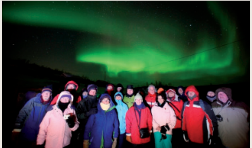
Mihttomearrin lea ahte Finnmárku galgá árkálaš vásáhusaid njunnošis.