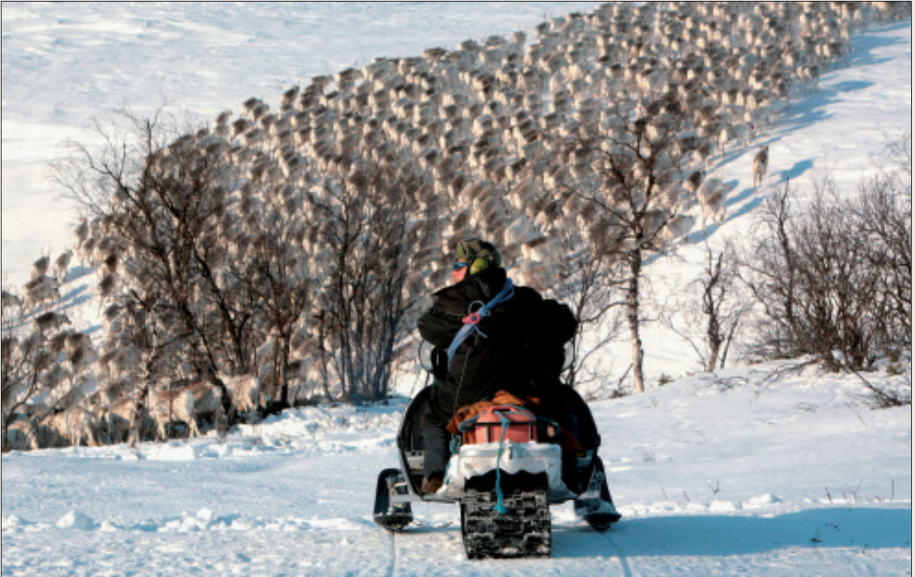
Finnmárkku riggodagat ovddastit árbevieruid, kultuvrralaš, dálkkádagaid, birrasa ja luonddu iešvuođaid ja šláddjivuođaid.