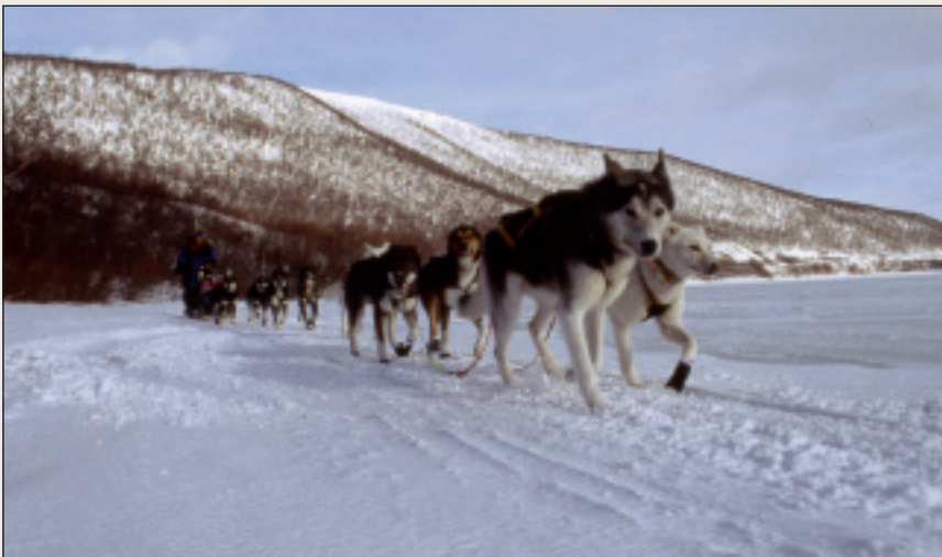
Finnmárku beanagilvu lea máilmmi davimus beanagilvu ja stuora dáhpašus.

Eará stuora oassi lea hotealla- ja restoráŋŋasuorgi. Dán suorggis gávdnojit sihke smávva ja stuora oasálaččat. Mánŋa ođđa hotealla leat ceggejuvvon Finnmárkkus, earret eará Áltái ja Girkonjárgii. Suorggis lea hui dárbu bargofápmui, earenoamážit goahkka ja