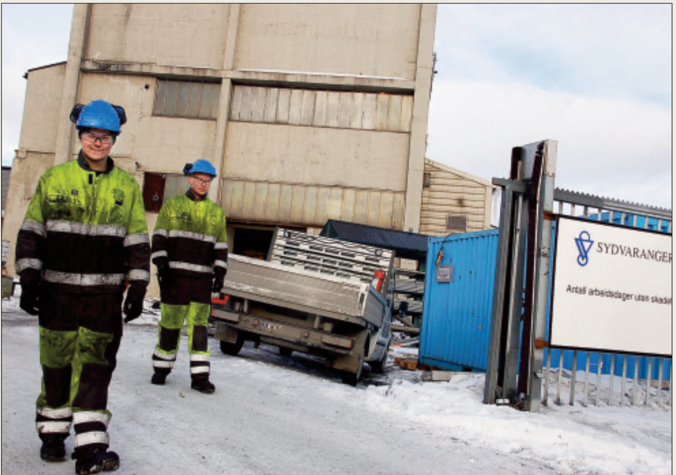
Ruvkedoaimma ja minerála fágaskuvlaoahppa lea vuoruhansuorgi maid fylkkadiggi áigu erenoamážit vuoruhit.