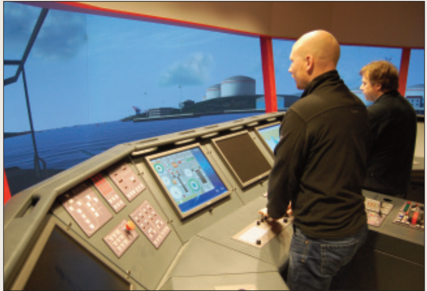
Davvenjárgga maritiibma fágaskuvla osttii ođđa ovdáneaddji simulatuvrra jagis 2008.

Skuvllas lea tehnikkalaš dávviriin alla standárda maŋjel go jagi 2008 dahke stuora investeremiid, ja skuvla lea áidna riikkas mas lea ecdis/ais dohkkehuvvon simulatuvra. Fágaskuvllas lea dehálaš