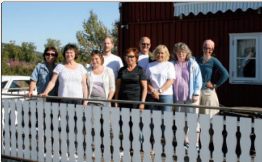
Giellalávgun borgemánus 2011 Bissojogas.