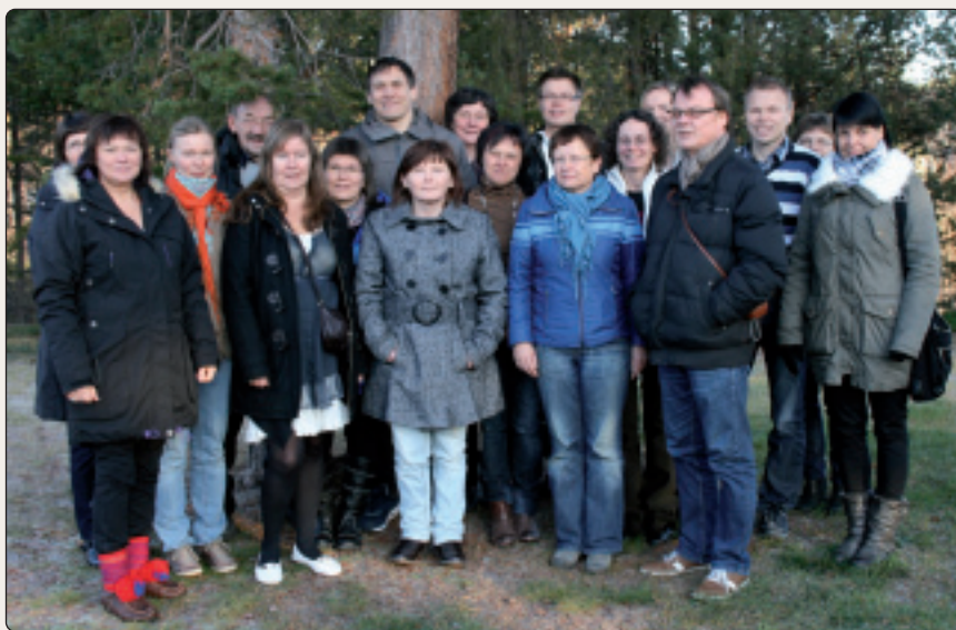
Giellagiella čoahkkin golggotmánus 2011, Kárášjogas.

Fylkkagielda lea juo mánga jagi buvttadan sáme- ja dárogeielat seaidnekaleandara oktan mearkabeivviiguin čalmustahttin dihtii sámegeiela. Kaleandara lea bures vuostáiváldán, ja sáddejuvvo buot doaimmahaide, politihkkariidda ja ovttasbargoguimmiide. Dehálaš dokumeanttat nugo guhkesáiggi plánat ja fylkkagieldda jahkediđáhus jorgaluvvojit sámegeillii. Dát almmuhuvvojit maid