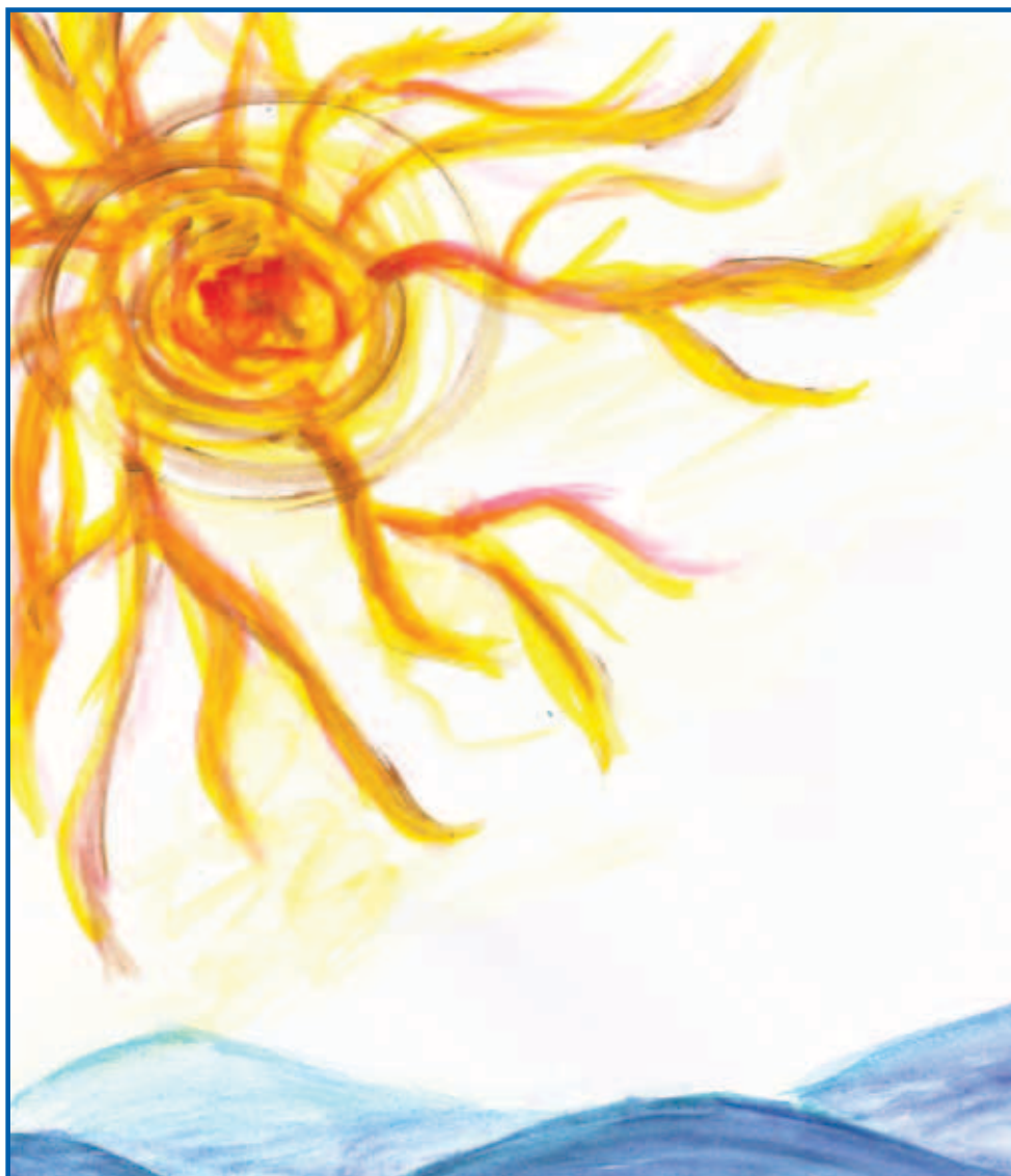
Nea Valkeapää (detallija)