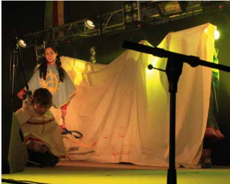
Enontekön koulun ryhmä / Eanodaga skuvlla joavku Jietnahelmmot .

Tapahtumaan oli kutsuttu kaikki saamelaislapset ja -nuoret sekä saamen kielen ja saamenkielisten luokkien oppilaat. Osallistuminen oli mahdollista myös koulujen ulkopuolella toimiville nuorille. Kuvataidekilpailuun tuli töitä myös Oulun saamenoppilailta. Kutsuvieraina olivat Ruotsin Karesuvannon saamelaiskoulun oppilaat opettajineen.