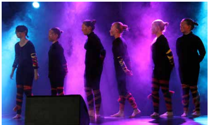
Jutatokka, foto AN.

Gangstajuŋkkát (foto Vesa Toppari/Yle Sápmi)