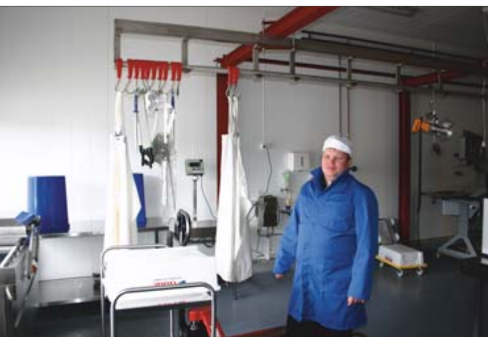
Finish. Eierne av bedriften har lagt vekt på at anlegget skal ha en høy standard. Lite er overlatt til tilfeldighetene. Her fra produksjonshallen.