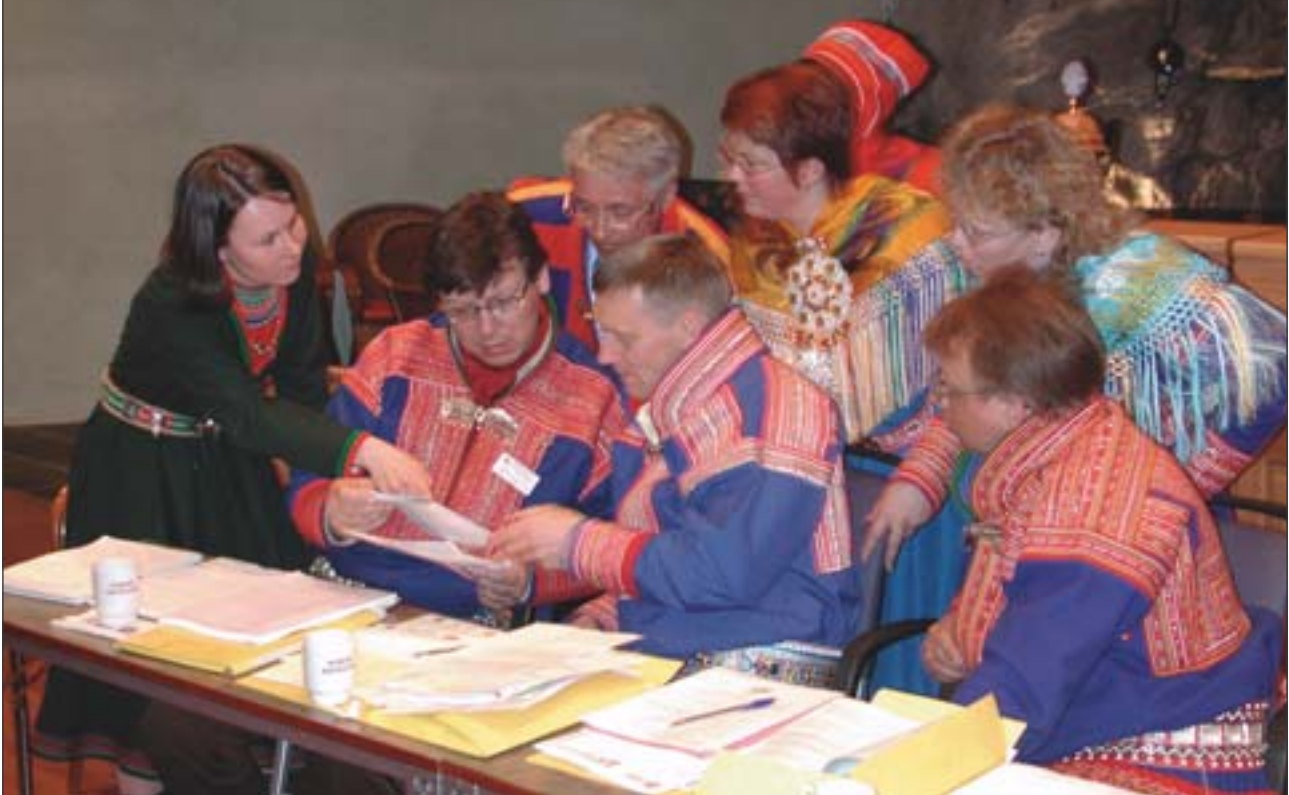
Mange viktige saker. Fra årsmøtet i Harstad i fjor der diskusjonene var mange. I år vil kamp om ledervetet, vindmøller, reinntall og rovvilt skape debatt.