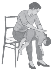
Vierrodiŋgga eretváldin vuoigŋankanálas

Jos diŋga ii velge luovvan, čohkket stullui, jor- gal máná čoavjjális iežat čippiid nala nu, ahte máná oaivi heŋgá roahkka vuollelis goruda ja spežže vihtta geardde beađbedávttiid gaskii oalle garrasit. Jos dátge ii veahket, de spežže vuoruid mielde vihtta geardde beađbedávttiid gaskii ja deattaš vihtta geardde mielg- ga vuolleoassái. Deattaš dušše nuppi gieđa goapmir- máddagiin, das lea doarvái fápmu stoahkanahkásačča mielgga deattašeapmái.