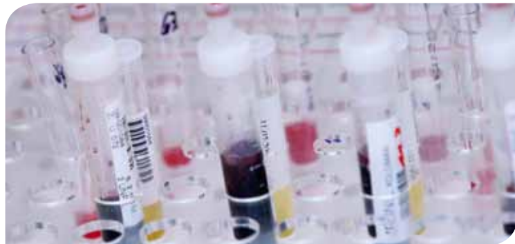
Illustrasjonsbilde av en testrør i et laboratorie.

Iskkusboadus ii atte okto doarvái buori vuođu mearridit diagnosa.