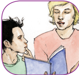
2. Oahppe/ æjgádagárvedibme sijdan