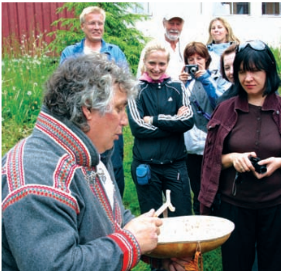
Juojggamijn ja goabddájn. Sámekultuvra ja moattebelakvuoda ávddánbukte. Med joik og tromme. En formidler av den samiske kulturen og dens mangfold.

- Muv buoremus rádna li 70 jagijs 90 jagijda, tjále dav, hæjtá Hætta, májudallam tjalmij.