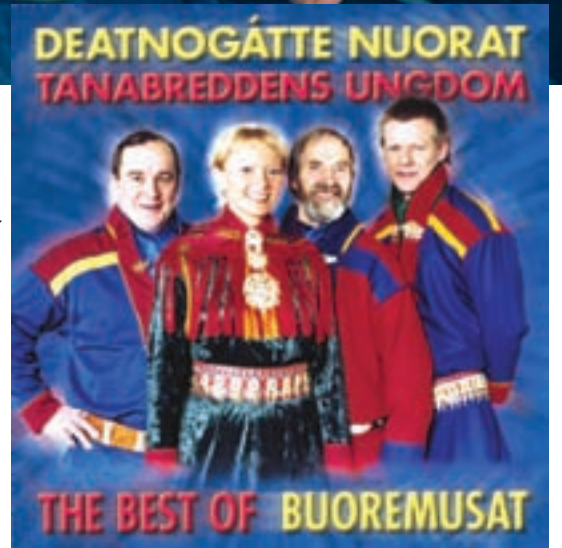
Ávdediddje. Gá Dædnogátte nuora jagen 1974 juojgav pláhtan spieledij ja dajna vuorbástuvvin, dát álov ávdedij. Banebrytende. Da Tanabreddens Ungdom i 1974 spilte inn joik på plate og fikk suksess med det, så var det banebrytende på flere vis.

Tæksta: Børge Strandskog Järggálibme: Divte Media AS