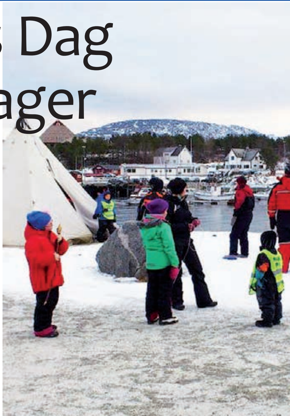
På Tysfjord ASVO tirsdag; Uteliv med lassokasting, steking av pinnebrød, vedklyving og båltenning.

senter. Sammen med kommunen kan Arran bidra til en fortsatt styrking av samisk språk og kultur, mente han. - La oss bli bedre på å fremsnakke positive ting og ikke låse oss fast i saker vi oppfatter som negative. Det fører sjelden mye godt med seg,