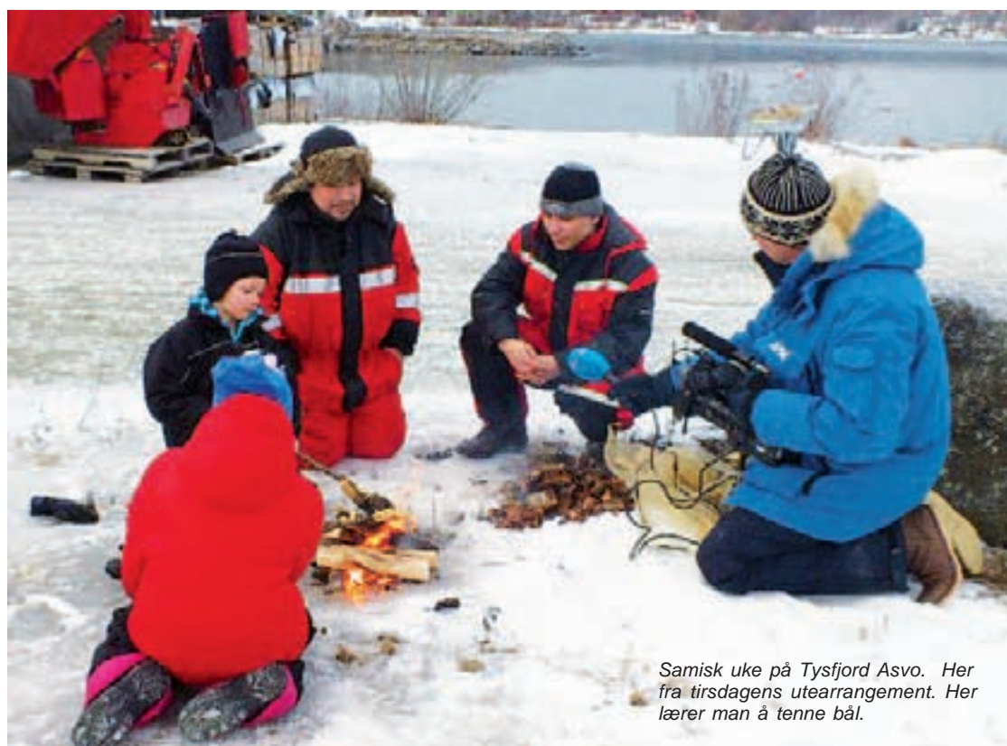
Samisk uke på Tysfjord Asvo. Her fra tirsdagens utearrangement. Her lærer man å tenne bål.