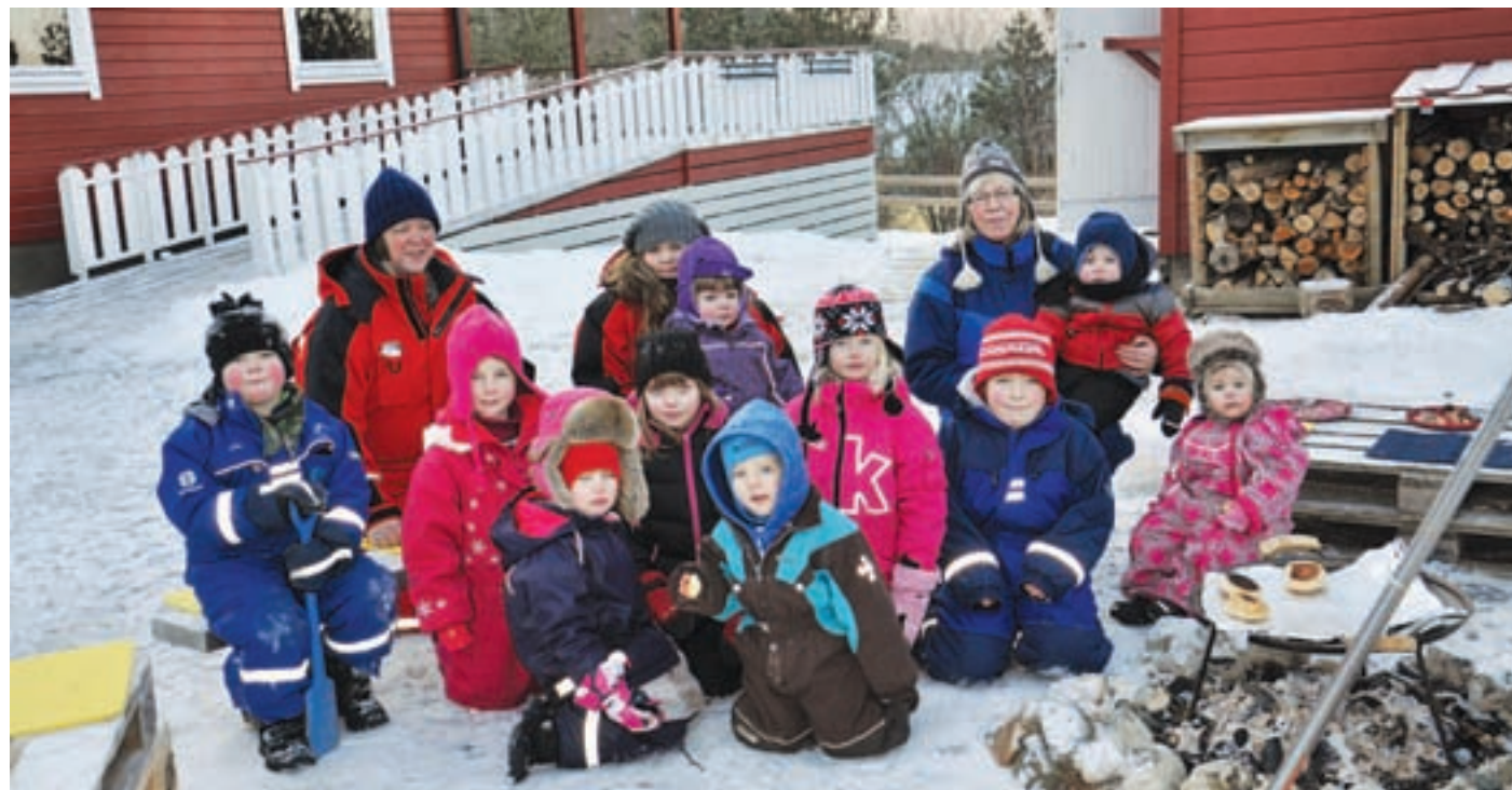
Strávnjunnje mánejgárde aj sáme bievjida oassálastij. Dánna hávsskudallin dálá birra bidosijn ja gáhkoj. Innhavet barnehage deltar også på samisk uke. Her koser de seg med bios og gahkko rundt bålet.

- I Tysfjord spiller Arran-Lulesamisk senter en spesiell viktig rolle for samisk språk og kultur, og har siden åpningen utviklet seg til et betydelig kompetanse-