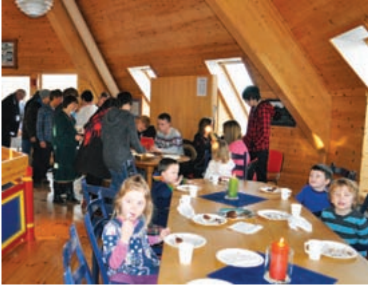
Árran kafea láptán: Oahppe Ájluovta skávlás ásadin lápptákáfeav káfajn ja gáhkkoj, sisboados le klássamannuj Englándaj vuoratjismáno. Árran kafea på loftet: Elever fra Drag skole hadde loftskafé med kaffe og kaker, inntekten gikk til klassetur til England i april.