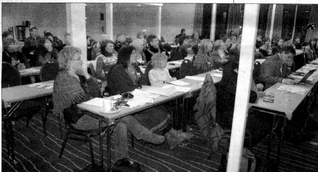
89 ovccii sámegiela fága bargit ledje čeahkkanan symposiain. Symposia lea allaoahppan olbmuid čeahkkanearpmi gos sáhttet filosofalaš gažaldagaid ovdidit. Greihkká gielas mearkaša dat juhkat ovttas, muhto sámegiela fágabargit gal ledje sihke čielgasat ja čilgosat.

Sámegiela fágabargit čuorbášedje sámegiela gielladivvunreaiddu divvut. no mii galgá dihtoris divvut čállinmeattáhusaid čállosiin dihtoris. Vaikko prográmma lea "čuorbi" de dat álkida normerejeddiid barggu.